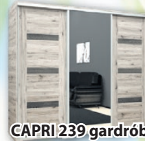
CAPRI 239 gardrób