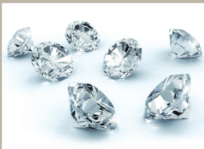
Brillians felvásárlás 49.900 Ft/g is lehet (egyedi árképzés)