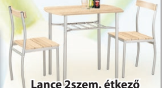
Lance 2szem. étkező