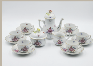
Herendi készletek, dísztárgyak, figurák felvásárlása