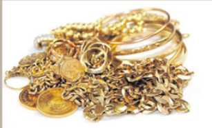
Arany felvásárlás 12.500 Ft/g-tól 25.000 Ft/g-ig (Világpiaci ár változása miatt az árváltozás jogát fenntartjuk.)

Körmend, Körmendi Kulturális Központ • Berzsényi Dániel u. 11. (különterem)