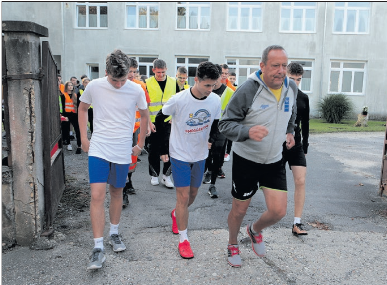
2023 métert futottak a gimnazisták

Új műfüves pálya készült az Olcsai-Kiss Zoltán Általános Iskola udvarán. A pályát - amelyet szülői összefogás eredményeként létesítettek - a Magyar Diáksport napján adták át használatra a diákoknak.