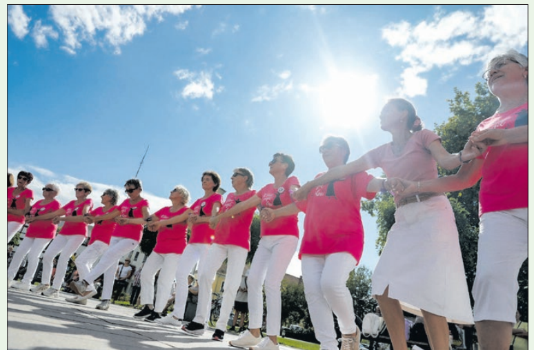
Az időseknek a torna rendkívül előnyös

egy hatvanan. A program már hagyományosnak mondható, hiszen minden évben összejönnek a világnap alkalmából, a szenior örömtánc ugyanis az idős szervezethez igazított, kíméletes sporttevékenység és „agytorna”, ami a legújabb kutatások szerint eredményesen késlelteti a demencia és az Alzheimer-kór kialakulását. ■ TJ