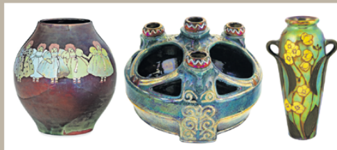
Zsolnay körpecsés tárgyak 500.000 Ft-tól akár 1.000.000 Ft-ig (eozinos antik)