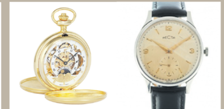
Kar-Zseb-Fali órák felvásárlása Omega, Vacheron, Doxa, Movado, Angelus, Rolex, Patek Arany zsebóra (láncsal együtt) 500.000 Ft