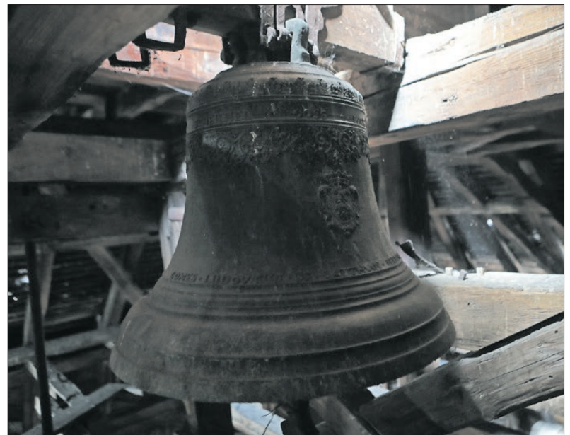
A harang 1734-ből való