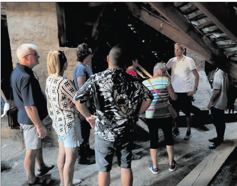
Az északi lépcsőházból a padlás felé vezetett az irány

bízásából. A Batthyány család - pontosabban a boldoggá avatott herceg orvos, dr. Batthyány-Strattmann László fia - 1945 márciusáig lakott a kastélyban, akkor a szovjet katonák elől külföldre, Bécsbe kellett menekülnie. 1957 után - amikor a szovjet katonák kivonultak az épületből - a kastély egyik melléképületében cipőgyárat rendeztek be, a főépületben pedig kollégium működött a 2000-es évek elejéig. Ez megérne egy újabb bejárást. ■ TJ