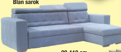
90-110 cm heverők