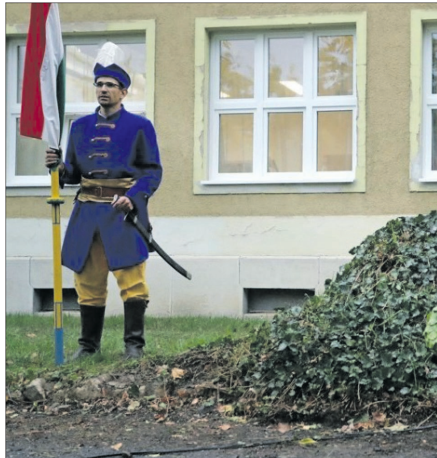
Körmenden a Rákóczi úton a Rázsó előtt található az Aradi vértanúk emléktáblája

Már a kivégzés napján kezdetét vette az áldozatok tárgyi hagyatékának gyűjtése is. Az egyre szélesebbre dagadó országos kegyelet hatására emlékeztető kiadványok születtek, amelyek terjesztésénél még az üzleti szempontok is megjelentek. Sokszorosított formában számtalan kő- és olajnyomat került a piacokra, vásárookra, amelyekből még ma is forgalomban van jó néhány. Thorma János „Az aradi vértanúk” című festményét a nép előbb ismerhette meg sokszorosított olajnyomatos formában, mint a műértő közönség eredetiben, hiszen politikai okokból először csak 1905-ben állították ki a művet. A nyomtatott emléklapok hatására a népművészetben is megjelentek a vértanúhalált halt tábornokok ábrázolásai. Ezek közül külön kiemelkednek azok a Veszprém vármegyében készült díszbotok, ahol a pásztorfaragások hagyományos technikájával, a könyomatos képek másolásával több változatban készítették a dísz- és sétabotokat. A nemzet az aradi hősök emlékezetét számos formában őrzi. Aradon már 1890-ben emlékművet avattak tisztelőkükre. Több nagyvá-