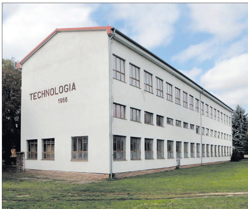
1966-ban a felsőfokú mezőgazdasági technikum szakmai feltételeit a Technológia épületével bővítették

1 Vas Népe 3. évf. 216.sz. (1958. szeptember 2.) 3. p.