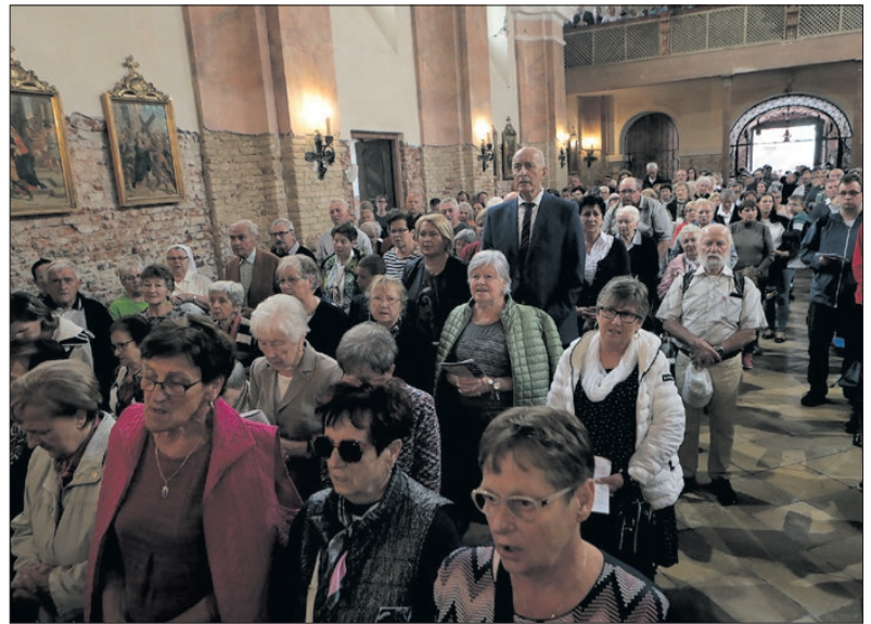
Megtelt a plébániatemplom és annak kertje is