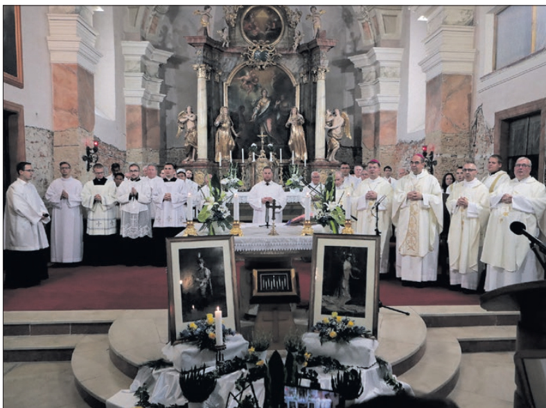
A boldoggá avatott herceg orvosra emlékeztek és feleségéért imádkoztak