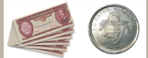
Forgalomból kivont valuta, ezüstpénzek, kitüntetések (1945 előtt)