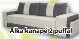
Alka kanapé 2 puffal