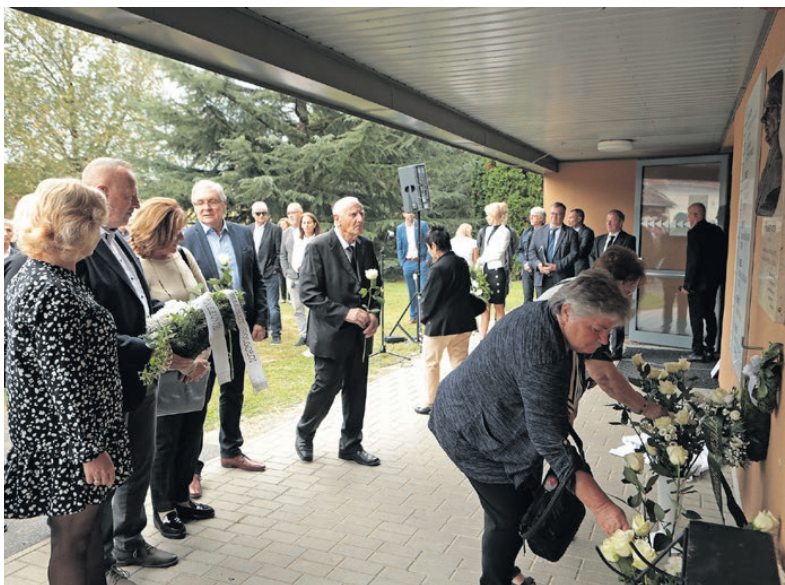
Családtagok, egykori kollégák, barátok, betegek egyaránt tiszteletüket fejezték ki és hálával emlékeztek