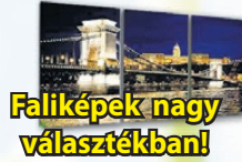
Faliképek nagy választékban!