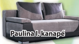
Paulina l. kanapé