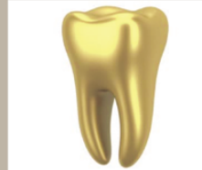
Aranyfog felvásárlás magas áron 25.000 Ft/g