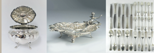
Ezüst dísztárgyak, evőeszköz készlet (hiányos is) 150 Ft/g-tól 660 Ft/g-ig