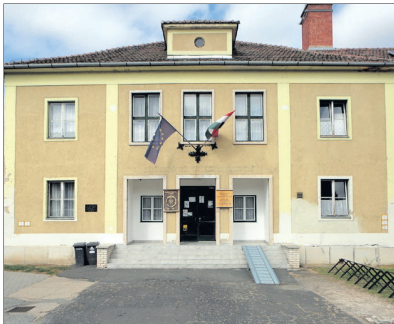
Az épület mára jelentős fejlődésen ment keresztül

„Új általános iskola épült a községben. El is készült időre, de az épület környéke telve volt törmelékkel és a csúnya udvar szégyenére