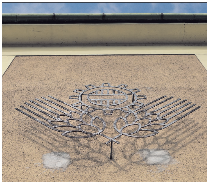
Apró részletek a homlokzaton