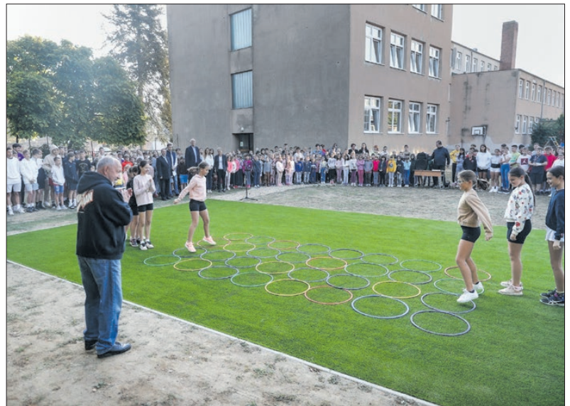
Az Olcsaiban az új sportpálya jó szolgálatot tesz