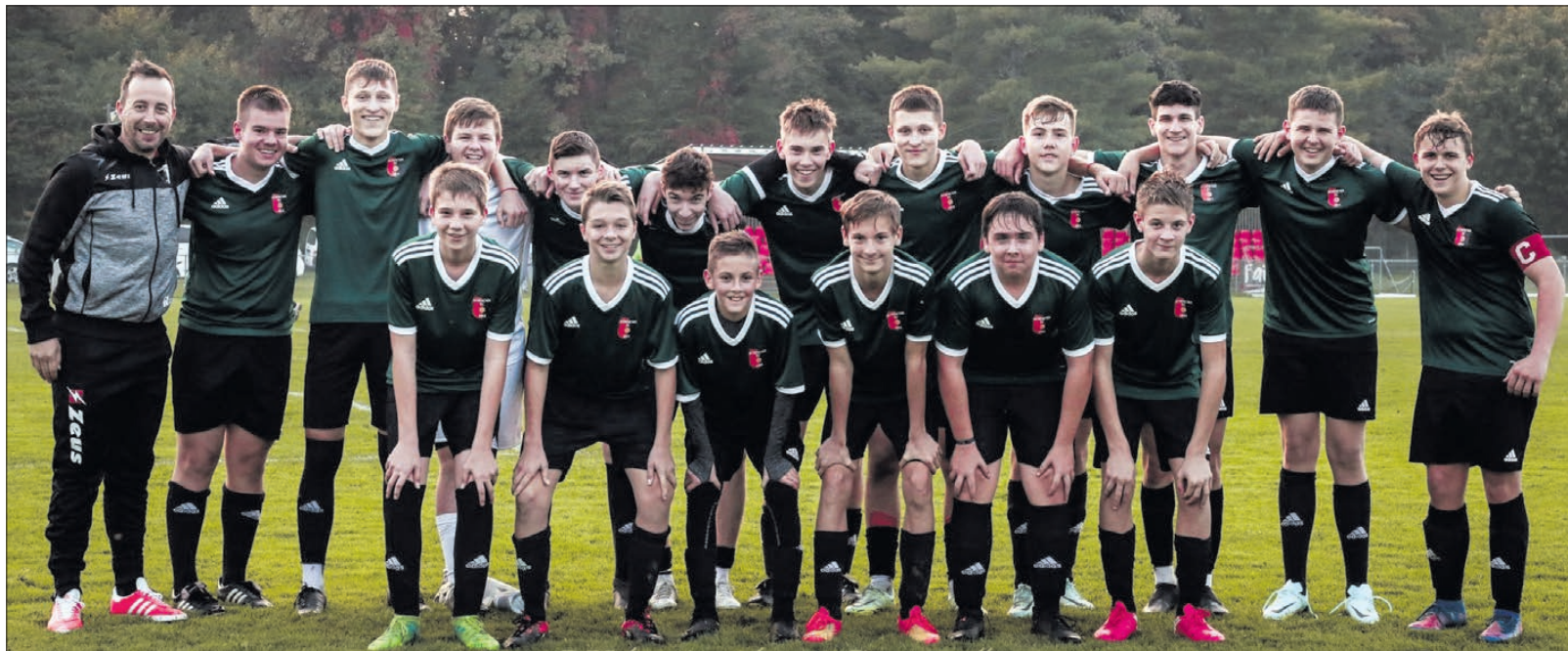
A Körmen di FC- Vasi Sekolo Kft U16-os bajnok csapata