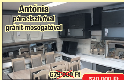
Antónia páraelszívóval gránit mosogatóval