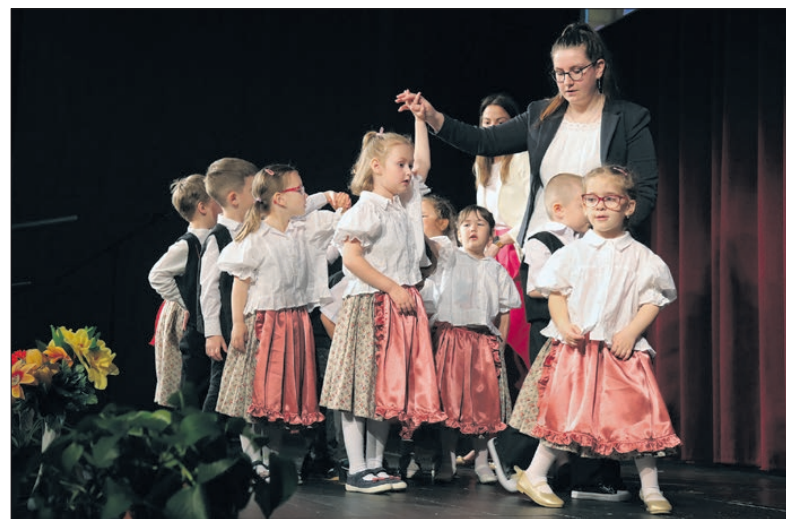
A Dr. Batthyányné Coreth Mária Óvoda Mátyás Király Utcai Tagóvodája kedveskedett műsorral