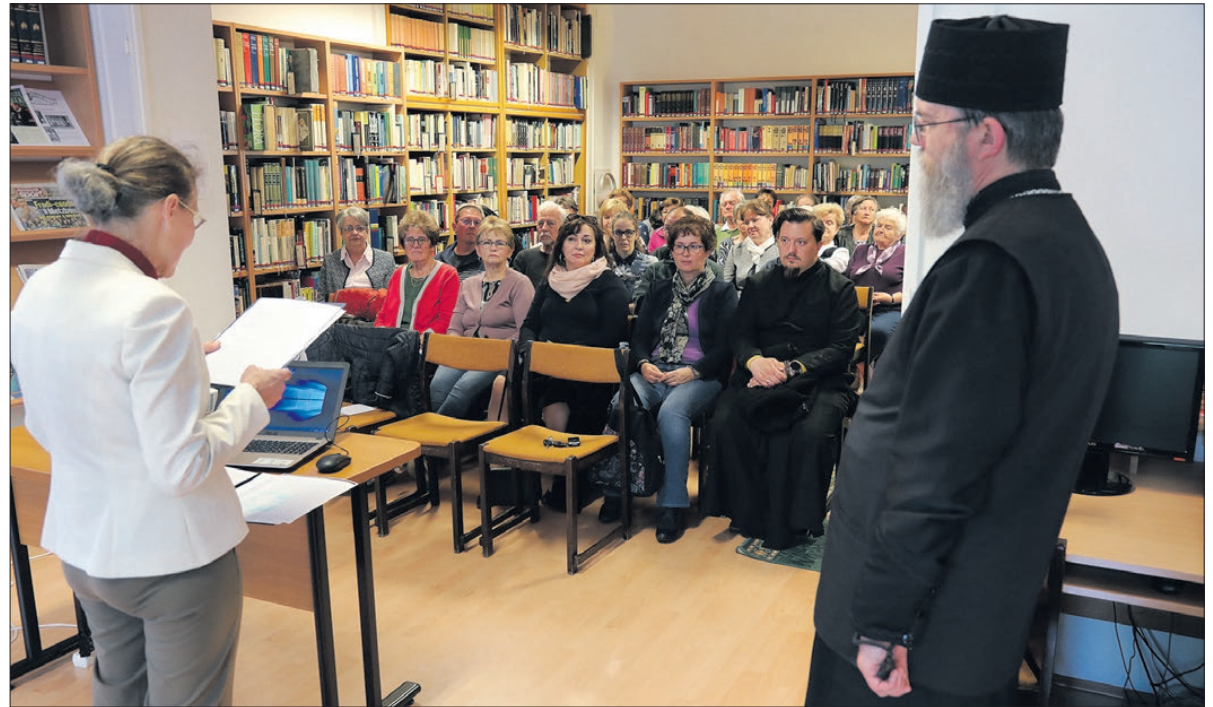
A KÉSZ előadások ingyen látogathatók.

A megszokott módon a Faludi Ferenc Könyvtár hírlapolvasója volt a helyszíne a Keresztény Értelmiségek Szövetsége körmendi csoportjának legutóbbi rendezvényének. Az előadó, a Pannonhalmi Bencés Gimnáziumban érettségizett 1978-ban. Filozófiai és teológiai tanulmányait a Pázmány Péter Katolikus Egyetemen végezte kitűnő eredménnyel, majd 1984-ben doktorátust szerzett teológiából. 1985-ben szentelték pappá Budapesten, ahol káplánként szolgált. 1987-től Rómában, a Lateráni Pápai Egyetemen tanult. 1989-ben a Szent Alfonz Akadémián erkölcszociológia, 1990-ben az Augustinianumban patrisztika diplomát szerzett, majd rövid ideig káplán volt Máriapócon. 1989-ben a nyíregyházi Görögkatolikus Papnevelő Intézet tanulmányi prefektusa és a Szent Atanáz Gö-