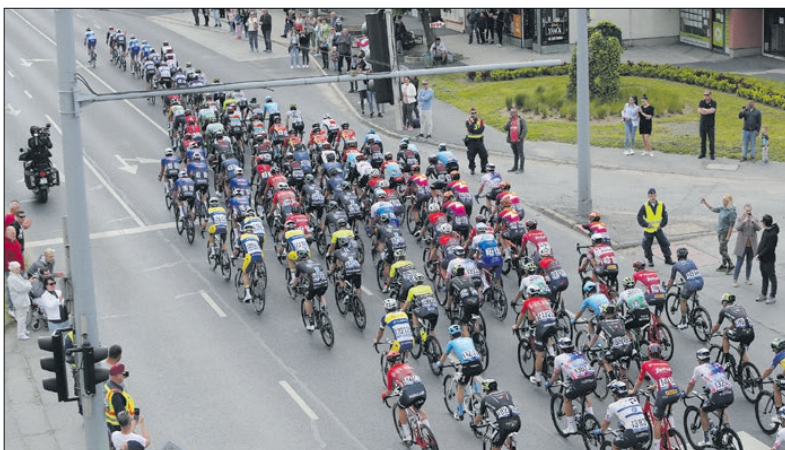
Kétszer is áthaladt Körmenen a Tour de Hongrie mezőnye