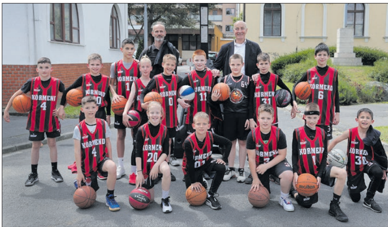
Az eseményre a Körmen Törpördögök is bemutatóval készültek