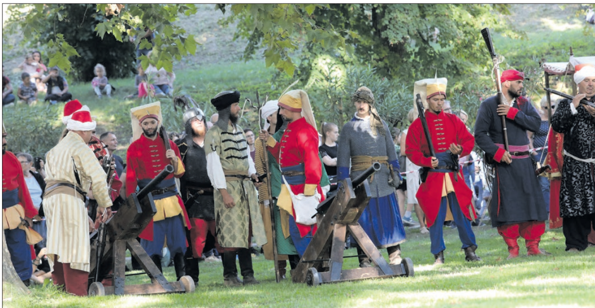
Szigetvár az emlékhely megismertetésére kreatív eszközöket használ, rendhagyó történelemórákat és viseletbemutatókat tart iskolákban, valamint tematikus múzeumpedagógiai foglalkozásokat és családi vetélkedőket is szervez.