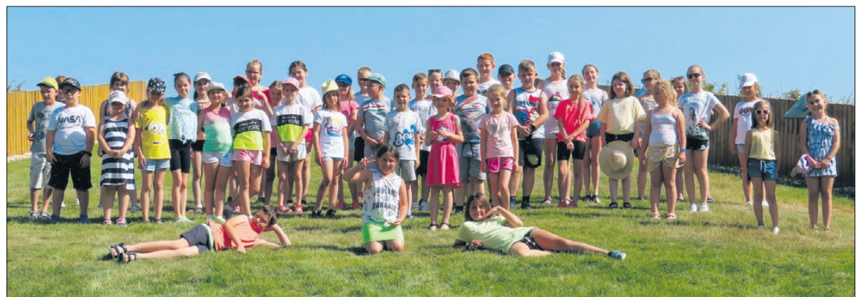
A program minden évben nagyon népszerű

- Ezen a nyáron is három turnust szervezünk, kettőt az alsó tagozatosoknak június 19-től 23-ig, illetve június 26-tól 30-ig. A harmadik turnusba a harmadik évfolyamosoktól a nyolcadik osztályba járó tanulóig várjuk a gyerekeket, a tervek szerint július 3. és 7. között -tájékoztatta lapunkat Wág-