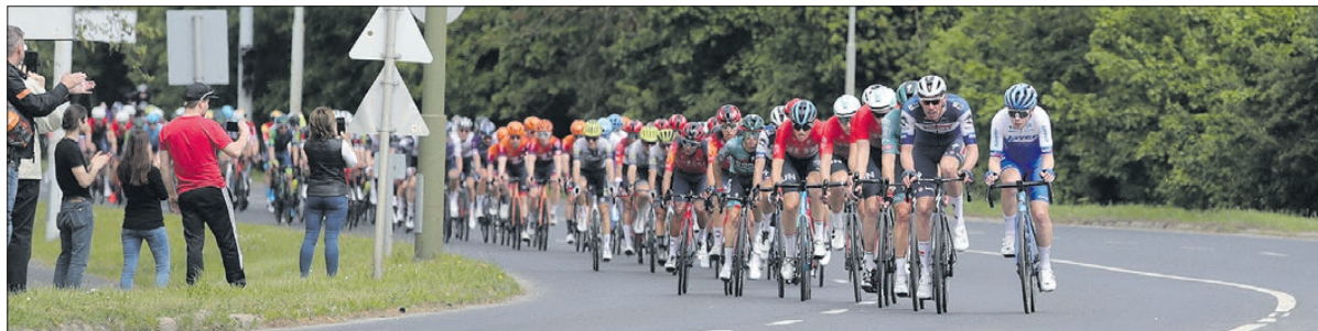
A versenyt 150 országban élőben közvetítették