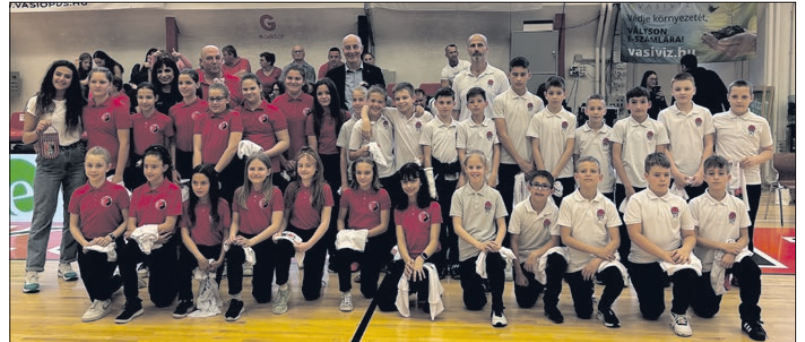
A szombati hazai mérkőzés szünetében köszöntötték az U11-es leány és fiú csapatot, akik neves akadémiákat legyőzve jutottak be az országos döntőbe.

A bajnoki döntőbe jutás párharc május 9-én, kedden folytatódik. Ha az Egis Körmend szépít, pénteken lesz a negyedik meccs a Városi Sportcsarnokban..