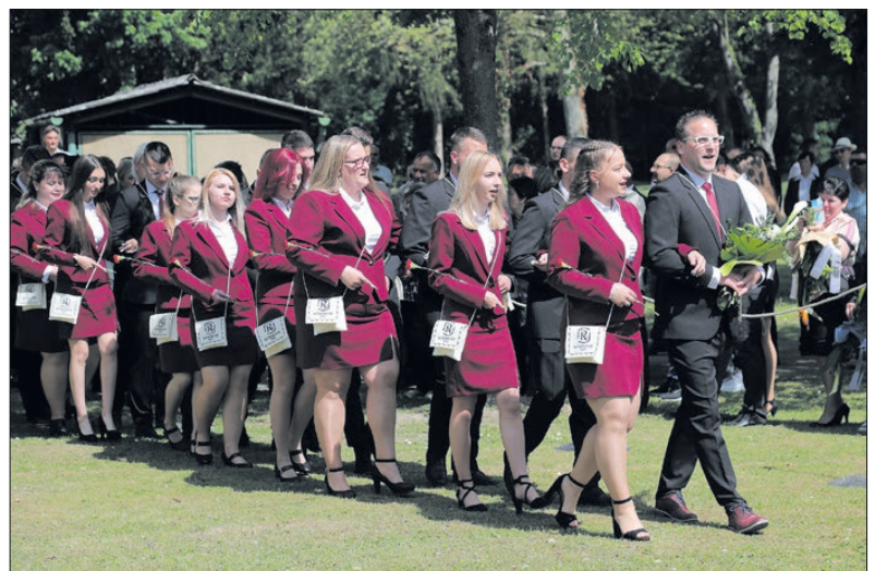
A ballagás után hétfőn megkezdtek az érettségit a diákok