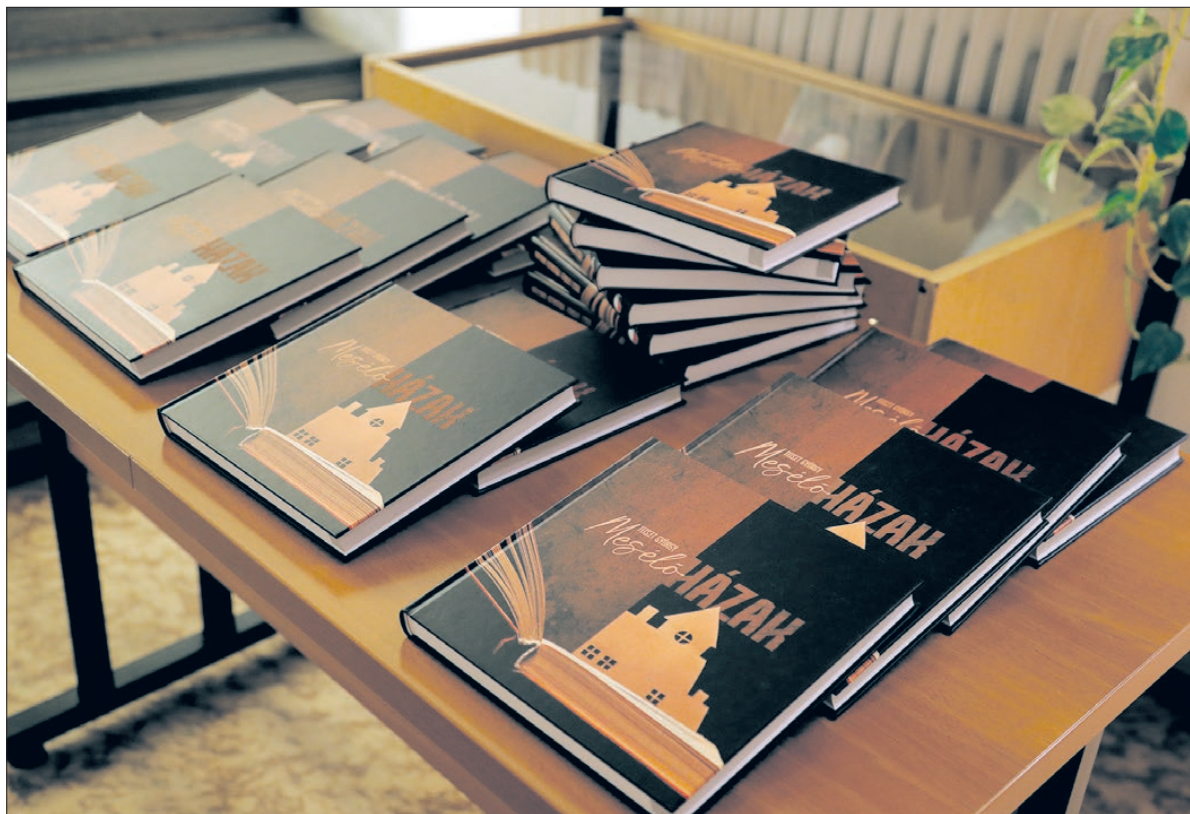
A kötet a megyei napilap korábbi írásait fűzte össze