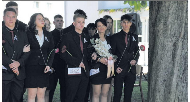
A gimnáziumban egy ballagó osztály volt