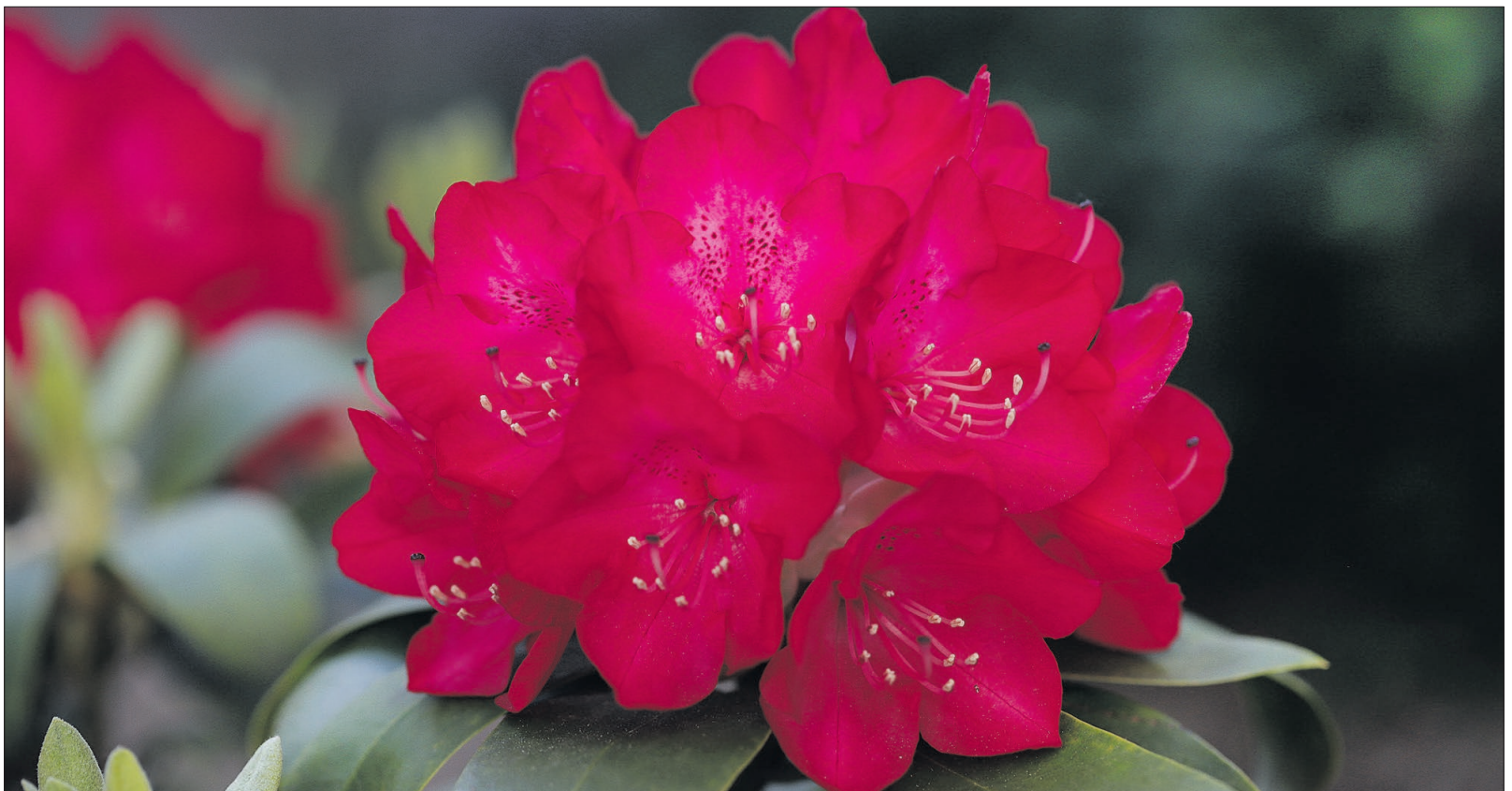
A rhododendronok csúcsvirágzása most kezdődik Jeliben

teit idézik az ültetvények, így a látogatók világkörüli utazásra indulhatnak. Egy másik fejlesztés a bambuszerdőben valósult meg, a japán erdő mellett. Itt közel 150 méter hosszú ösvényt vágtak a patak mellett a szakemberek, így a látogatók hat méter magas bambuszfal között sétálhatnak át az ösvényen. A kertben a látogatók komfortját növelő fejlesztések is történtek az utóbbi években. Kapott már új játszóteret, lombkoronasétányt is az arborétum. Korábban új öntözőrendszer készült, amely a nyári hortenziavirágzást is elnyújtja. A látogatóknak három helyen alakítottak ki páraparkokat a nagy hőség idejére. A száz éves jubileum alkalmából létrehozta egy 14 fajtából álló hárs-gyűjteményt is, ami egyedülálló Közép-Európában. Ezzel a magas botanikának is teret adnak még inkább. Bár az arborétum a szabadidős tevékenységeket szolgálja ki, mellette az ismeretterjesztésben is szerepet vállal például vándortáborok szervezésével gyermekeknek, de van még egy fontos szerepe is: nem csak faiskolai növényeket ültetnek, de egyfajta génbank szerepet is vállalnak az arborétumok, így a jeli is. A kert országosan is nagyon népszerű, évente 40-50 ezer látogatója van. ■ PM