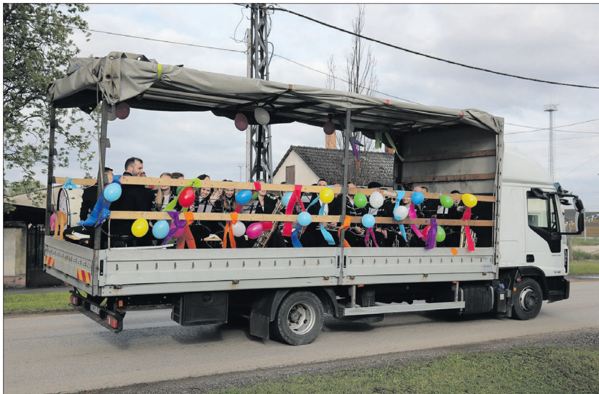
Teherautó platóján ülve járták körbe a várost körmendi fúvósok, így ébresztették a lakosságot

„A zenés ébresztésnek varázsa, különleges hangulata van. Szeretjük”-summázta a karnagy.