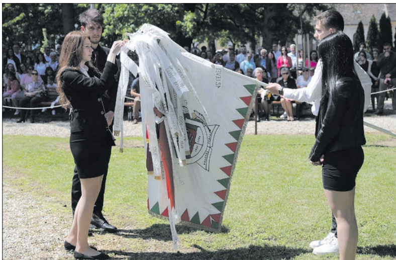
A végzősök szalagot kötöttek az iskola zászlójára

figyelmes, empatikus, egymást segítő, őszinte közösség köszön el az alma matertől. Most olyan jelzőkkel illetem őket, amelyek talán mintegy szinonimái az elmúlt hétvégén Magyarországon járt Ferenc pápa gondolatainak, aki a fiatalokhoz intézett beszédében a sikeres élet lehetőségeiről egyebek mellett így fogalmazott: hogyan