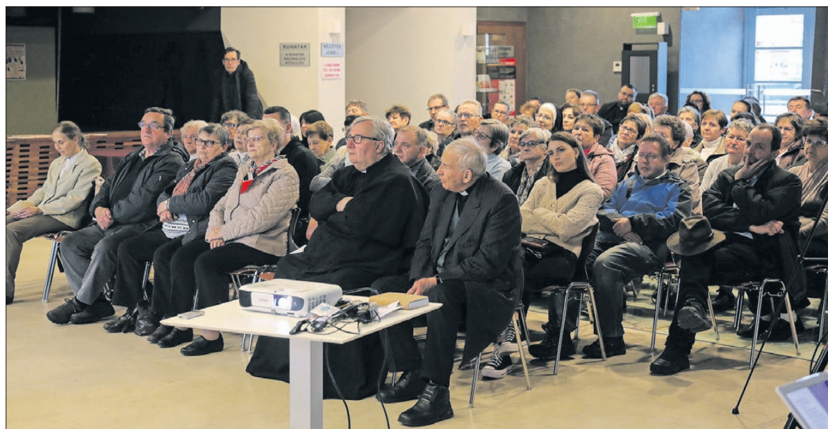
Az előadást nagy érdeklődés övezte

20 évvel ezelőtt avatták boldoggá Batthyány-Strattmann Lászlót, és ebben a jubileumi évben elindult feleségének a boldoggá avatási eljárása is. Nekünk, körmentieknek pedig nincs más dolgunk, mit őrizni emléküket és hinni.