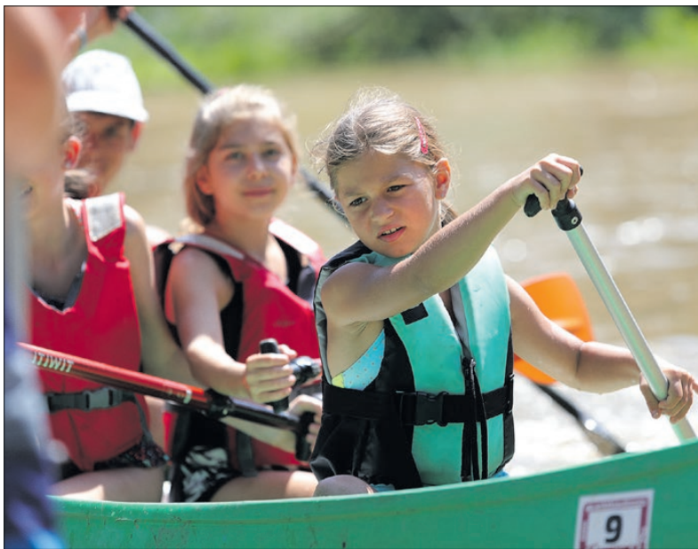
Töretlenül népszerű a vizes tábor