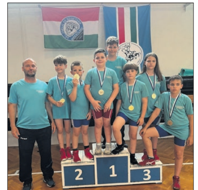
Idén már 25 arany, 15 ezüst és 9 bronzéremmel büszkélkedhetnek a körmendi birkózók