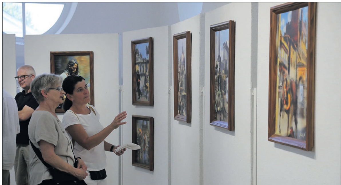
A kiállítás augusztus elejéig várja még a látogatókat a Városi Kiállítóteremben.

A kiállítás augusztus 6-ig tekinthető meg, keddtől vasárnapig, 10 és 18 óra között.