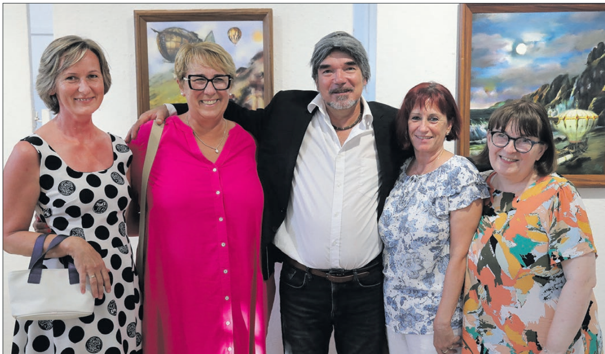
A megnyitóra sokan ellátogattak, köztük az alkotó régi ismerősei, barátai.

A Kölcsey Ferenc Gimnázium után ösztöndíjjal felvettek restaurátornak Budapestre. Akkor a Körmenden kívüli életem és ezekkel kapcsolatos szellemi és festészeti tanulmányaim onnan folytatódtak, de mégis az alapot Körmend adta