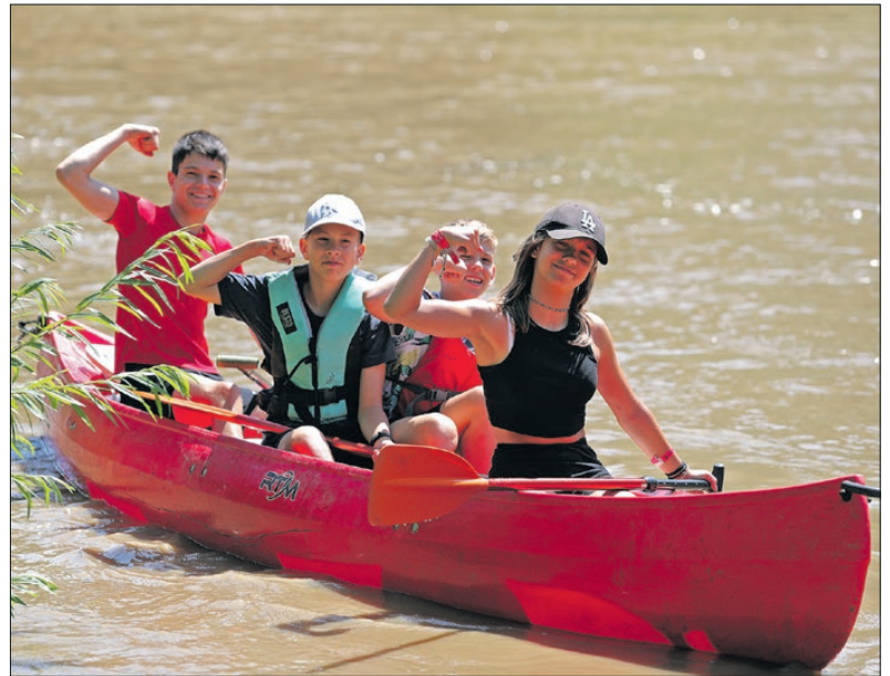
A legfiatalabb táborozó alig múlt hatéves, a legidősebb meg tizenhat éves középiskolás.