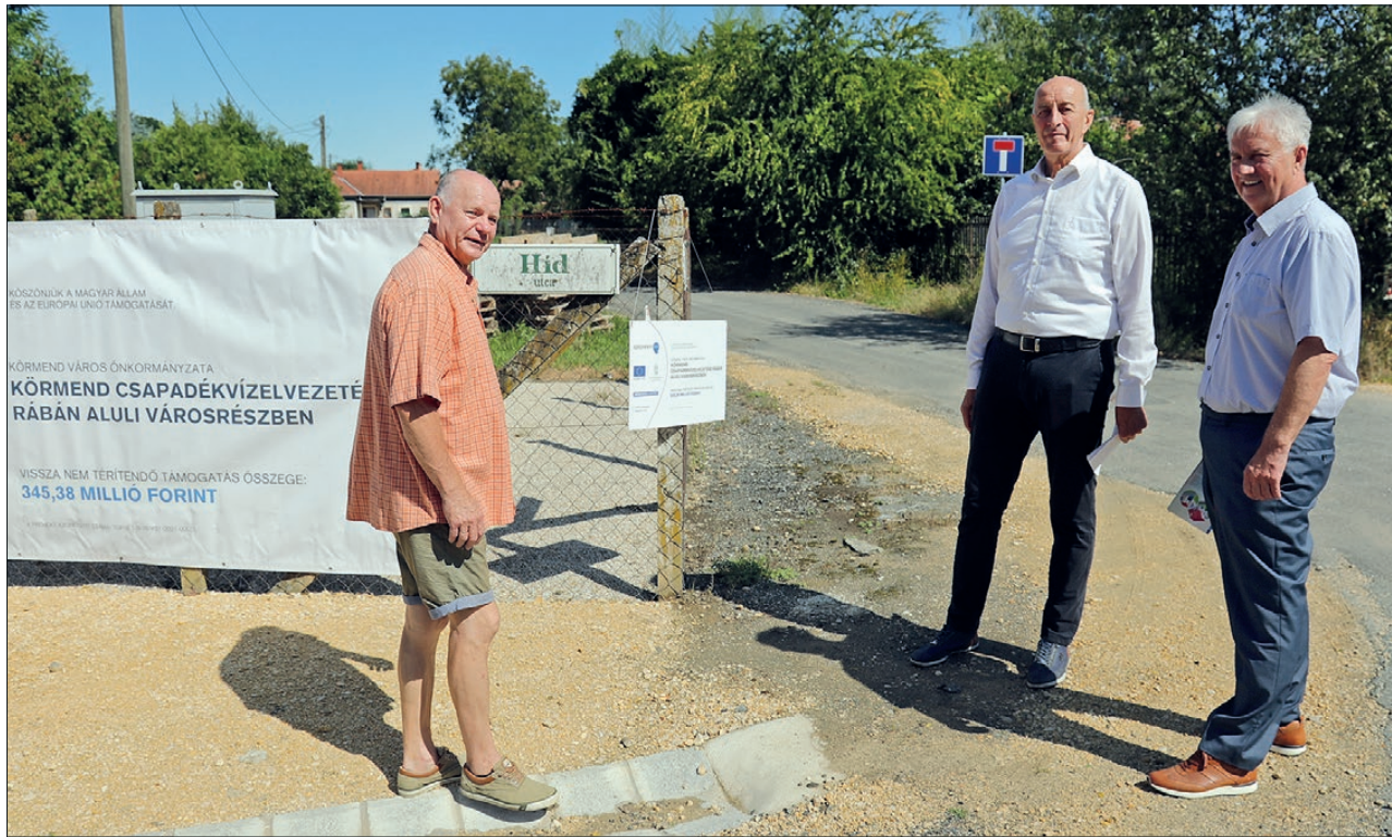
A mintegy 346 millió forintos projekt sokak életét megváltoztatja