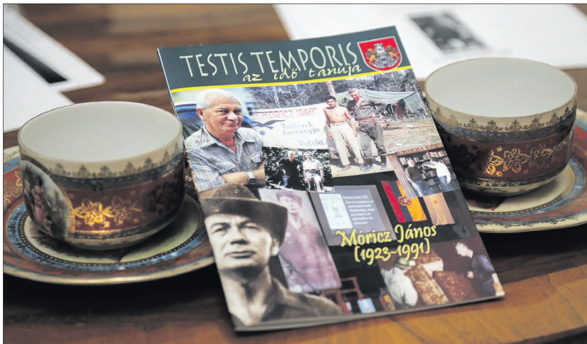
A Testis temporis sorozat legújabb kötete az Idők tanúja címet kapta