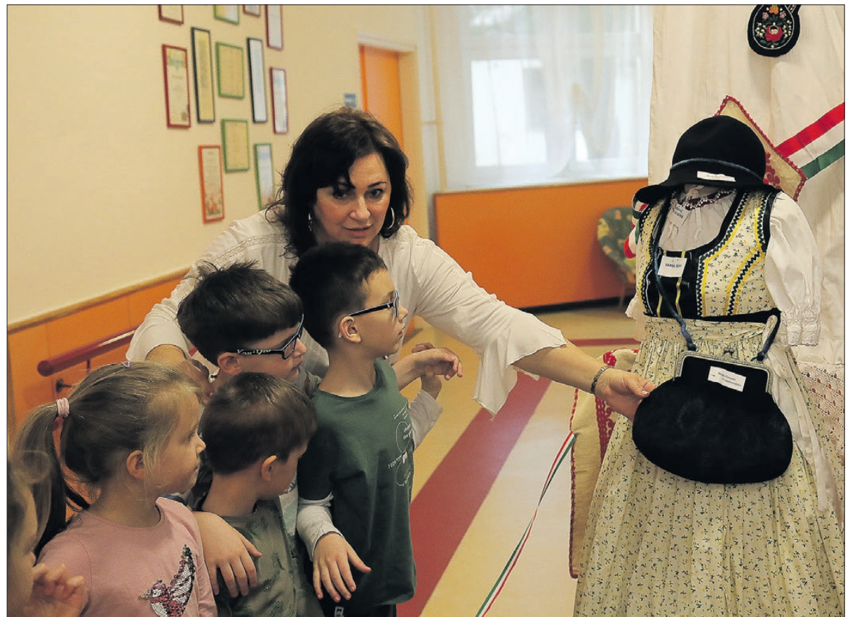
A kiállítás néhány hétig megnézhető

3. Az óvoda a gyermek nyitottságára épít, és ahhoz segíti őt, hogy megismerje szűkebb és tágabb környezetét, amely a nemzeti identitástudat, a keresztény kulturális értékek, a hazaszeretet, a szülőföldhöz és családhoz való kötődés alapja, hogy rá tudjon csodálkozni a természetben, az emberi környezetben megmutatkozó jóra és szépre, mindazok megbecsülésére. ■ MP