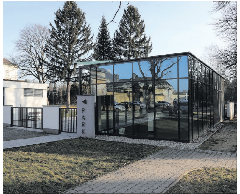
A régi cipőgyári épületek elbontásával a kastély és a kert kapcsolata helyreállt.

A kiállított tárgyak között lesznek 18–19. századi vadászfegyverek, a Várkertet ábrázoló térképek, a vadászlak első lakójának relikviái, a parkban űzött sportok – tenisz, koresolya, vadászat – emlékei, a Várkertbe épített cipőgyár termékei, valamint az egykori majálisokhoz kapcsolódó tárgyak. A várkerti eseményeket fotónagyításokkal idézzük meg, az 1944. évi várkerti ludovikás tisztavatásról pedig egy filmfelvételt fogunk levetíteni – részletezte a múzeumvezető. Az április végén nyíló kiállítás nem marad várkerti szobor nélkül, mivel az eddig elzárt északi kertben felállított Kybelé-szobrot a tárlaton is bemutatják. Egy új digitális fejlesztést is kínálnak majd: a Várkert szobraihoz, emlékműveihez és jelesebb fáikhoz táblákat helyeznek ki, amelyeken QRkódos játékok meg-