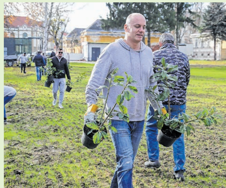
Az egyesület tagjai a város más civil szervezeteit is buzdítják arra, hogy csatlakozzanak a megmozdulásukhoz és tegyék együtt zöldebbé a várost.

Az egyesületnek egyébként a korábbi években hasonló megmozdulása a Vadászlak környékén, a Hősök terén és a IV. Béla király utcában volt. ■ MP