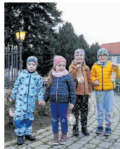
A gyerekek büszkék voltak az elkészített mécesekre