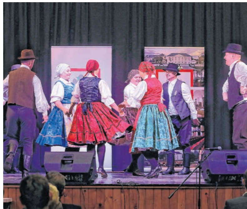
Az egyesületek nagy örömmel vették újra birtokba az épületet- a színpadon a Senior Néptáncgyűttes tagjai