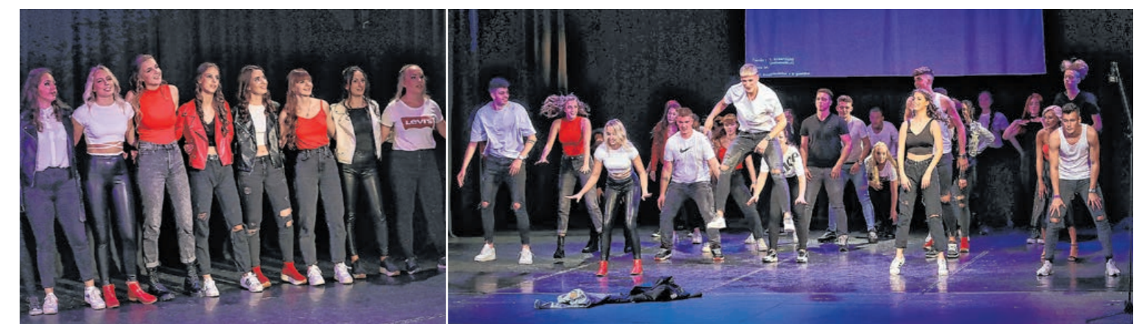
A végzősök zenés és táncos műsorral egyaránt készültek az eseményre