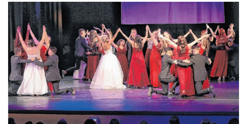
Az este a hagyományos nyitótáncsal indult