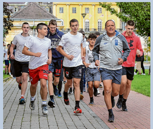
A program lehetőséget ad arra, hogy a diákok körében népszerűsítsük az egészséges, mozgásban gazdag életmódot.