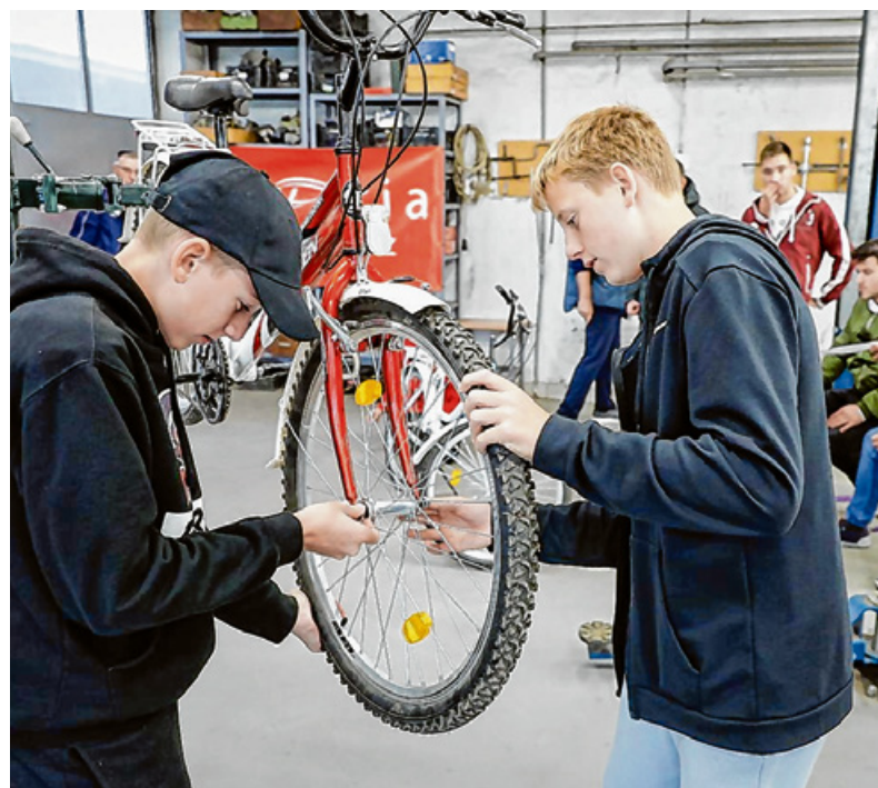
A feladatokat a kerékpárszerelés zárta.