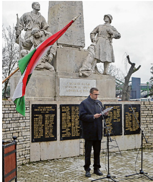
Körmenden ötven éve emlékeznek meg a Doni áttörés évfordulójáról

„Azt pontosan tudjuk, hogy a 2. magyar hadseregnek, amely odaveszett a Donnál, az egyik bevonulási területe Körmend volt. Tehát innen vitték a honvédeket a frontra. Továbbá ez megint egy olyan elhallgatott történet, mint a 12 éves orosz megszállás volt. Ugye abban a bizo-