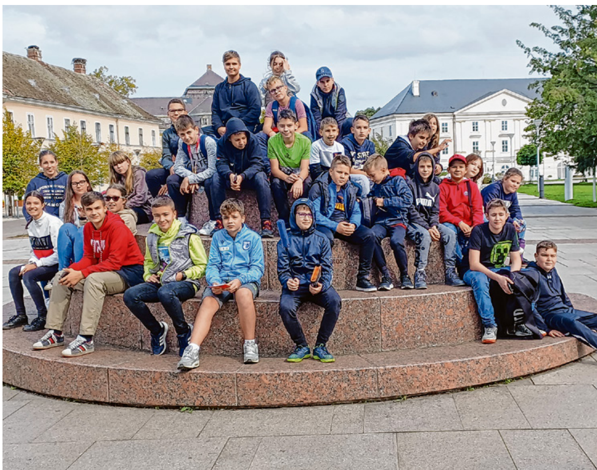
Kiszakadtak az iskolapadból, de mégis tanultak az Olcsai iskola diákjai