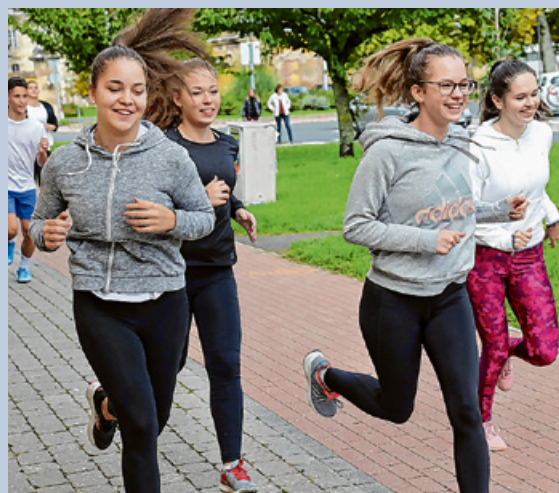
2022 métert is lefutottak a Diáksportnap alkalmából a Kölcsey iskola tanulói

A megmozdulásban részt vett többek között a körmendi Kölcsey Ferenc Gimnázium is. ■ SZD