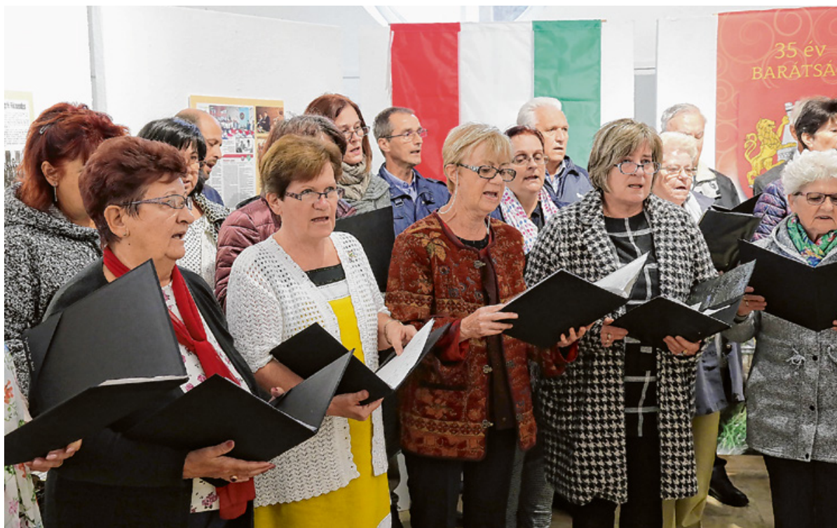
A kiállítás megnyitóján a Városi Vegyeskar és a Béri Balogh Ádám Táncegyüttes is közreműködött.

A Heinävesiből érkezett vendégek egy pályázati lehetőségnek köszönhetően töltöttek el egy hetet Körmenden. Nyáron körmendiek utazhattak Finnországba, köztük több fiatal is, akikkel megvalósítható a kapcsolatok újjáépítése.