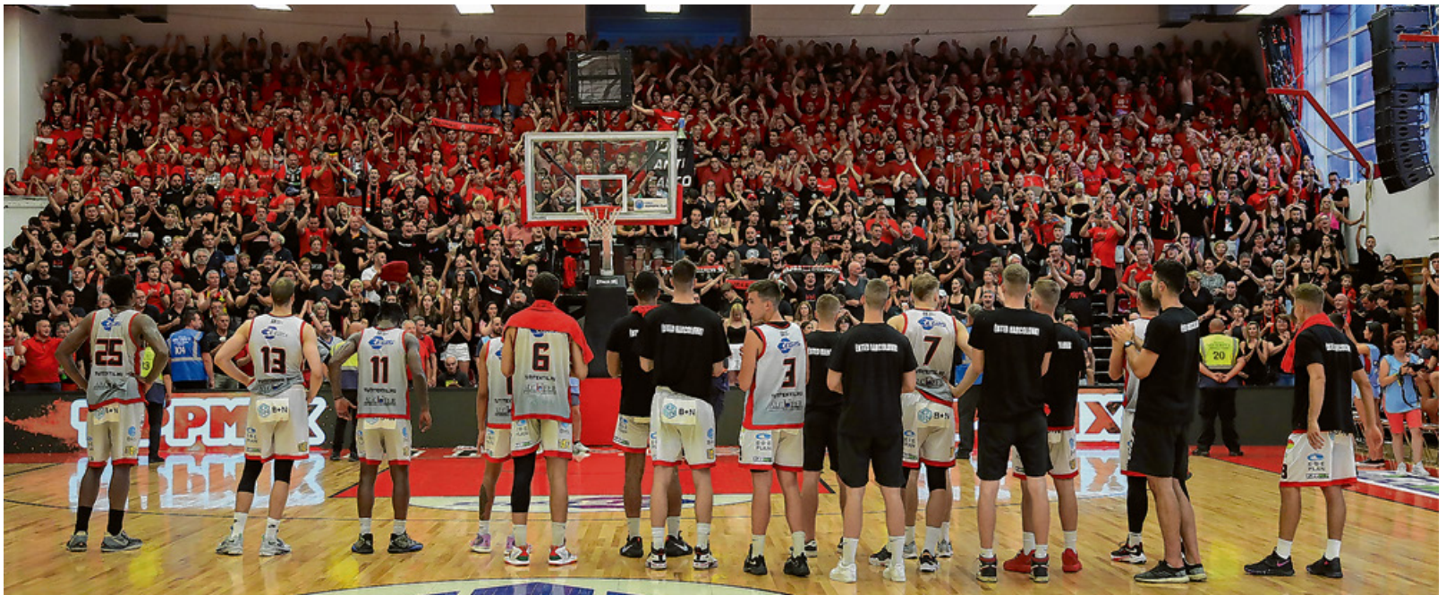
Október 8-án a ZTE ellen játssza első hazai bajnokiját a tavalyi ezüstérmes