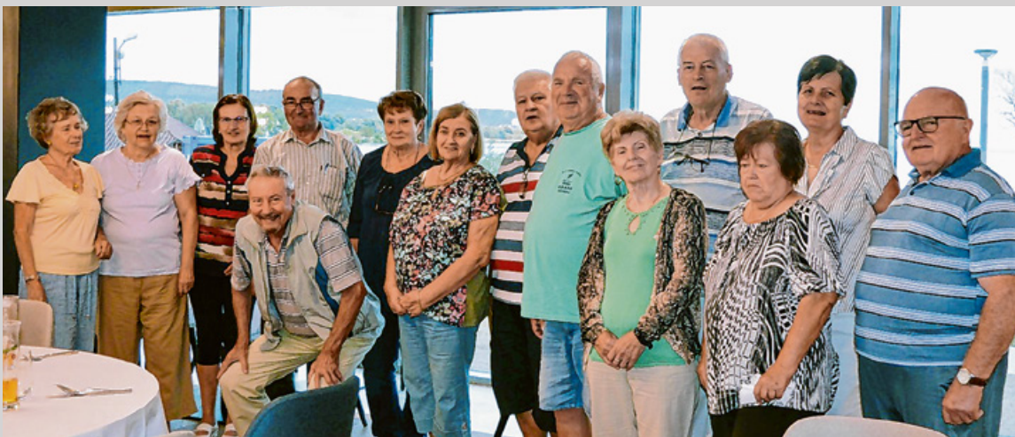
Vidám összejövetellel zárult a program