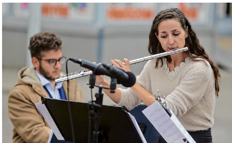
A fuvola régóta kedvelt hangszer a tanulók körében

A gyerekeket csillámtetoválás, arcfestés és hangszer kipróbálási lehetőség is várta.