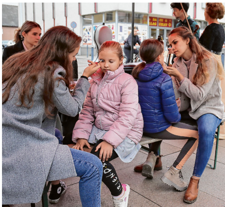
A rendezvényen a gyerekeket kísérő programok is várták