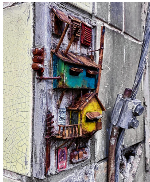
Jól megbújik a kis makett az egyik körmendi épületen

De mindig vannak ötleteim, akár rajzokra, makettek, most például a könyvzugok nagyon érdekelnek. Tehát mikor a könyvek közé ilyen kis maketteket illesztnek. Ez persze nem street art modell, de biztosan lesz csak kell egy hely, egy ötlet és az alkotáshoz idő. ■ SZD