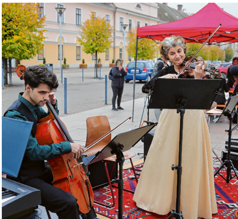
Az érdeklődők jó hangulatú szabadtéri előadást hallhattak