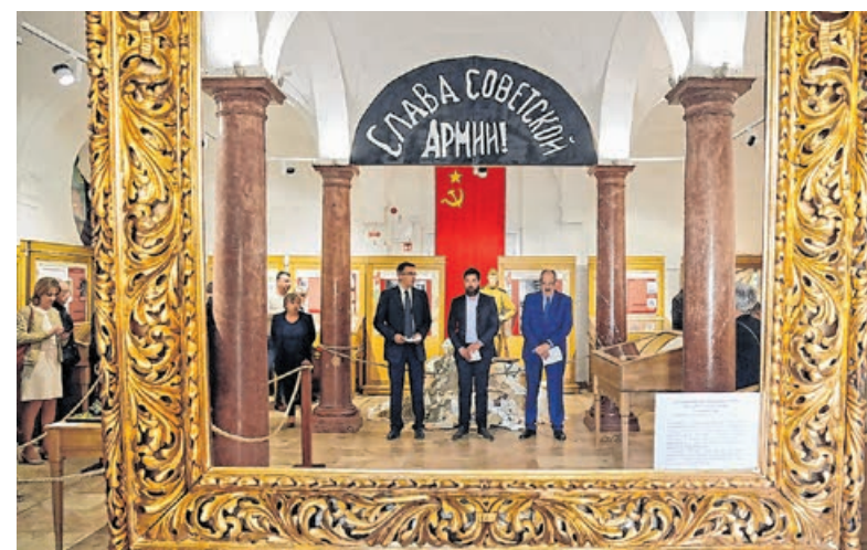
A kiállítóterembe lépve – jelképesen – egy üres képeret fogadja a belépőt

Korabeli feljegyzések, fotódokumentációk, épségben maradt és rongált fegyverek, könyvek, festm-