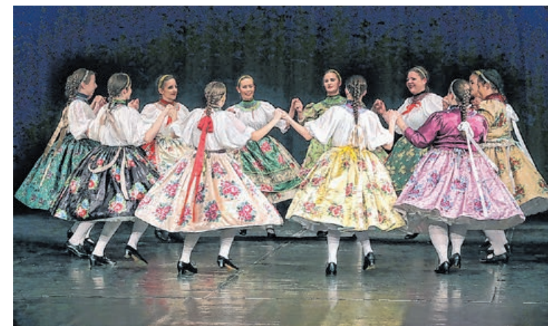
A BBÁ-s lányok karikázója

úgy születtek. És ennek a színpadon születő virágcsokornak még egy üzenete van, szeretettel adjuk az édesanyáknak, anyák napja alkalmából – hangzott el az esemény felütésékor, majd Sárköz táncgyománnyait láthatta a közönség, ezen kívül a somogyi karikázó, gömői táncok, Vág-Garam-közi táncokat is a színpadra állították. A zenekar bonchidai, szatmári táncdallamokat és katonadalokat játszott, Szilágyi-Varga Diána pedig gyimesi és vasi dalsokrot énekelt el a megjelent nagydéműnek. Szép címet adtunk a műsornak, „Szépen hasad a hajnal”, az egyik dalnak a sorából vettük ezt az idézetet – nyilatkozta lapunknak Korbaesics Tibor, aki hangsúlyozta: