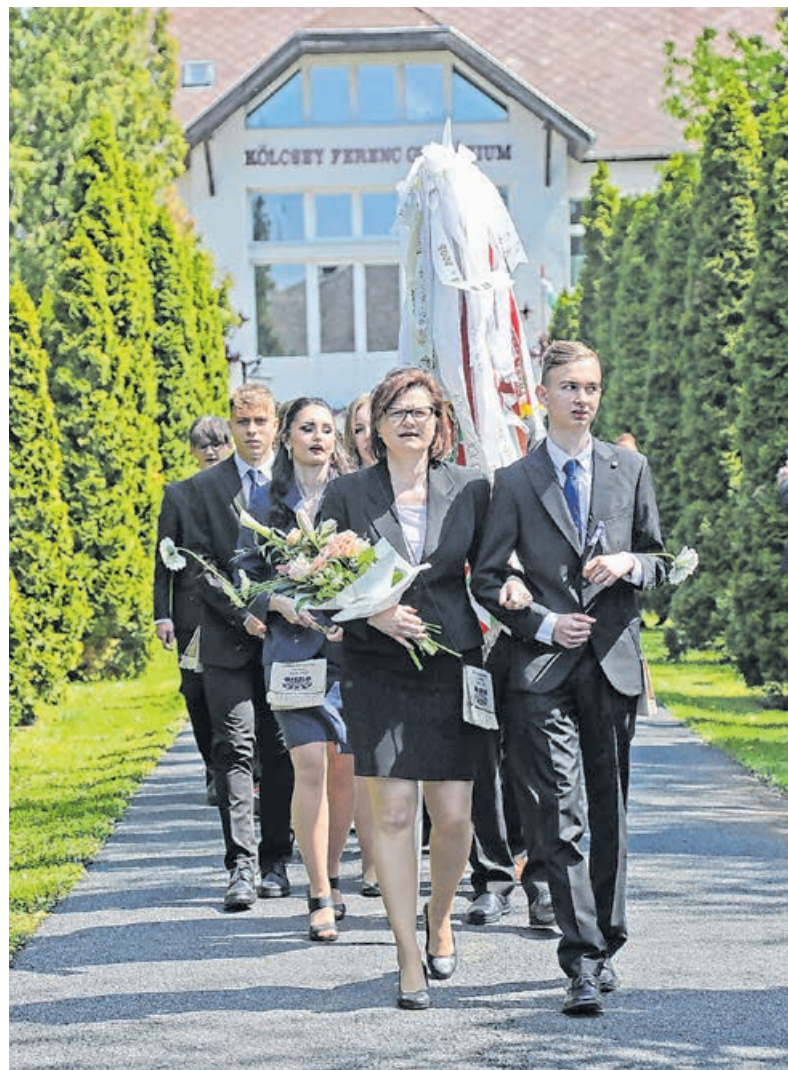
A Kölcsey Ferenc Gimnáziumból egy végzős osztály búcsúzott az alma matertől