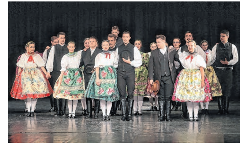
A közönség két új koreográfiát is láthatott