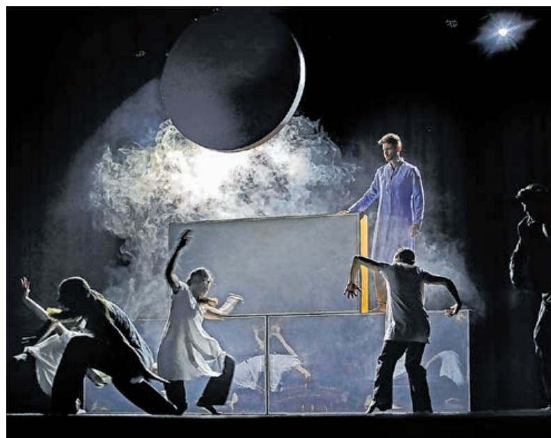
A Borszik Yvette Társulat táncosai maradandót alkottak

Móricz János a föld alatti Tayos-barlangban olyan „beazonosíthatatlan”, semmilyen ismert korábbi kultúrához nem köthető, hihetetlen ősi tárgyakat, fémkönyveket talált, amelyek bizonyítékok – egyéb földi építmények mellett – egy ősi, ma már elfeledett, ám fejlett civilizáció létezésére. A Kristályvilág című színdarab ugyanígy egy ősi civilizáció utolsó, kataklizma előtti napjait mutatja be. Nergal, az utolsó, Ataiszról megmenekült títán király és a halandóvá vált Killa, a Holdistenő életén keresztül. A két