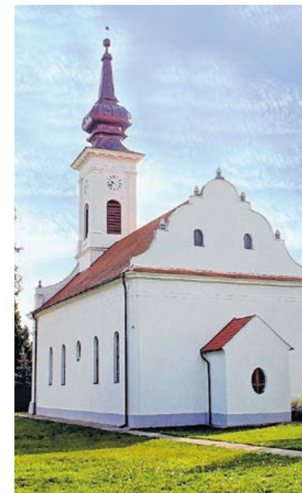
A református templom kívülről is, belülről is szép ékessége a városnak

– A református templom egyik érdekessége a freskók.