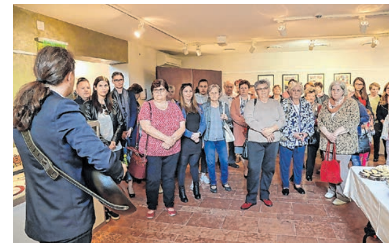
Lelkes kézművesek közössége Körmenden

Létrehozták az ASzakkör nevű interaktív felületet és a hagyományos alkotótevékenység egyes fázisaiba az internet segítségével vonták be az oldalt felkeresőket. Videókon keresztül díjmentesen biztosítottak és biztosítanak még ma is lehetőséget az egyes alkotótevékenységek megismerésére. Kínálva ezzel hasznos szabaddidő-eltöltési módot, amit bárki el- vagy újrakezdehetett – fogalmazott, majd