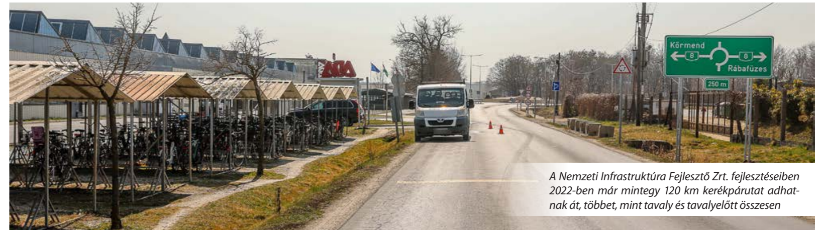
A Nemzeti Infrastruktúra Fejlesztő Zrt. fejlesztéseiben 2022-ben már mintegy 120 km kerékpárutat adhatnak át, többet, mint tavaly és tavalyelőtt összesen

A biztonságosan biciklizhető útvonalak hossza 2030-ra 15 ezer kilométer lehet