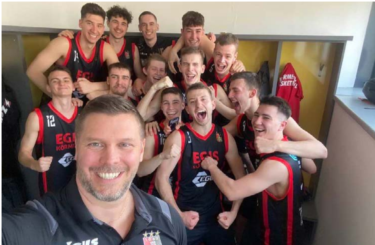
Huszonhat meccsből huszonhatot megnyertek a fiatalok