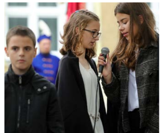
Színvonalas műsorral készültek a Somogyis diákok