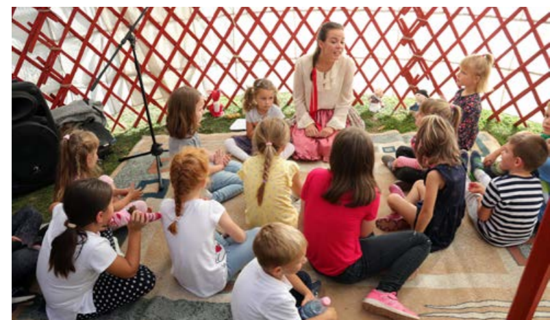
Különleges élmény volt a mesemondó jurta

Az intézményvezető köszönetet mondott a lebonyolításban való segítségért és támogatásért a helyi önkormányzatnak, a város gondnokságnak, a Régió Hagyományörző és Sport Egyesületnek, a Körmendi Kulturális Központ és Könyvtár dolgozóinak, a Sibaris quartetnek és az intézmény valamennyi dolgozójának, mint fogalmazott, nélkülük nem tudtak volna ennyi kisgyerek arcára mosolyt csalni. ■ SZD