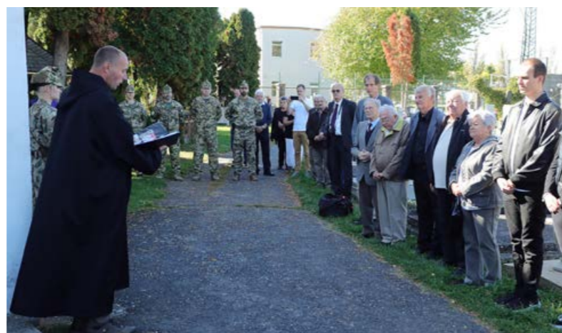
Arany vitéz emléktábláját avatták fel Körmenden

Az emléktábla megáldását követően a Horváth család tagjai koszorút helyeztek el a sírnál. ■ SZD