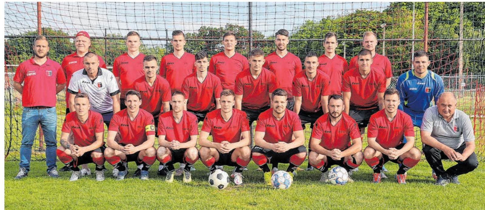
A Vas megyei I. osztályú labdarúgó-bajnokság 4. helyezettje