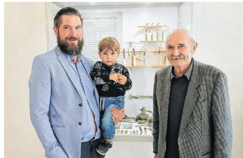
A Belencsák késes dinasztia tagjai