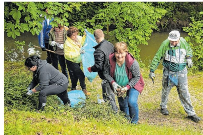
Jó hangulatban telt a nap

A gyülekező és regisztráció után mindenki magához vette a szükséges védőeszközöket, szerszámokat, hulladékgyűjtő zsákokat és a tiszorai-csomagokat, majd a résztvevők gyorsan munkához is láttak. Mindenki tette a dolgát, összesen huszonhat csapat dolgozott a várkert különböző részein. A civil szervez-