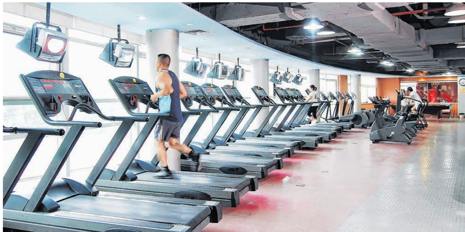
A jelenlegi látogatószám országszerte 40–60 százalékkal marad el a járvány előttihez képest a konditermekben