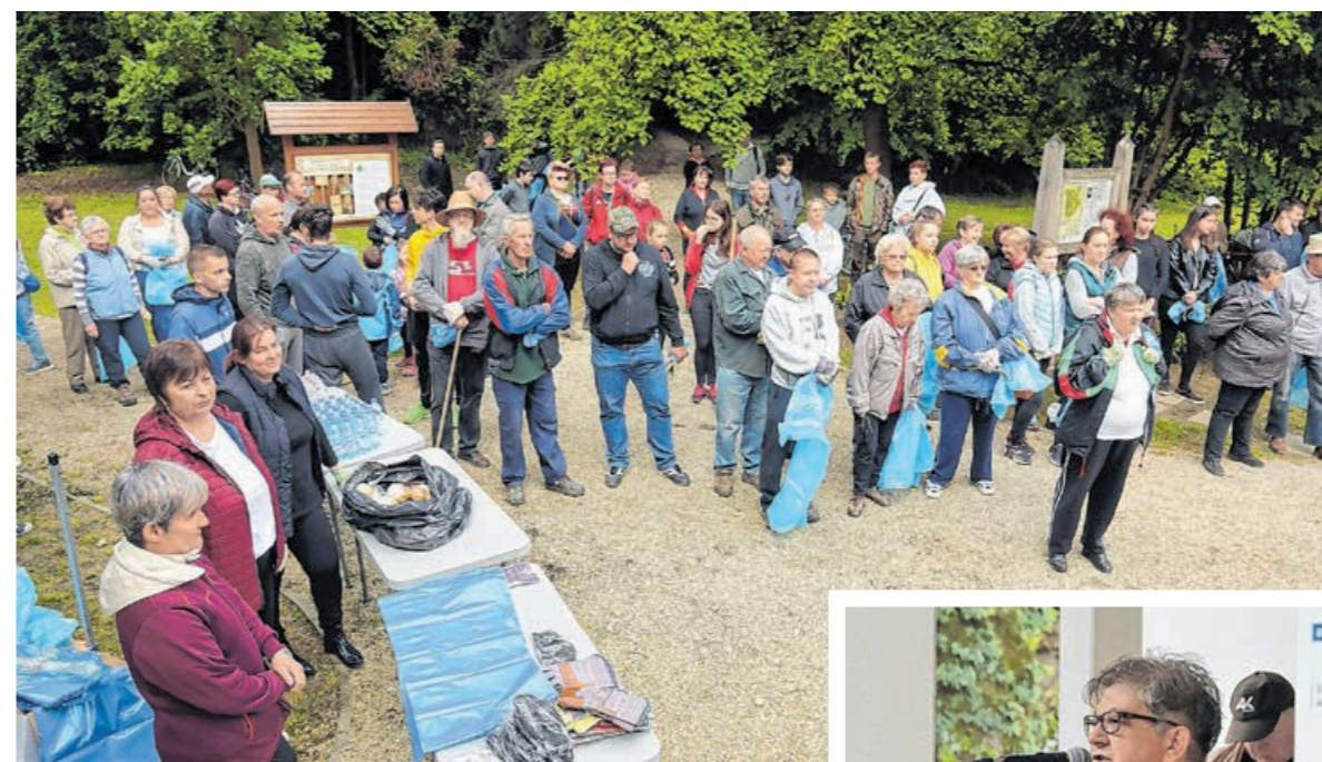
Fiatalok és idősek is aktívan részt vettek a programon

A kőrmendi önkormányzat a kulturális központtal a várkerthez kapcsolódó projekteket valósított meg múlt hétvégén. Bemutattak egy online ismeretterjesztő előadást, amiben a várkert értékeire helyezik a fókuszot, volt egy kötetbemutató és a helyeket is megszólították egy nagyobb közösségi esemény keretében.