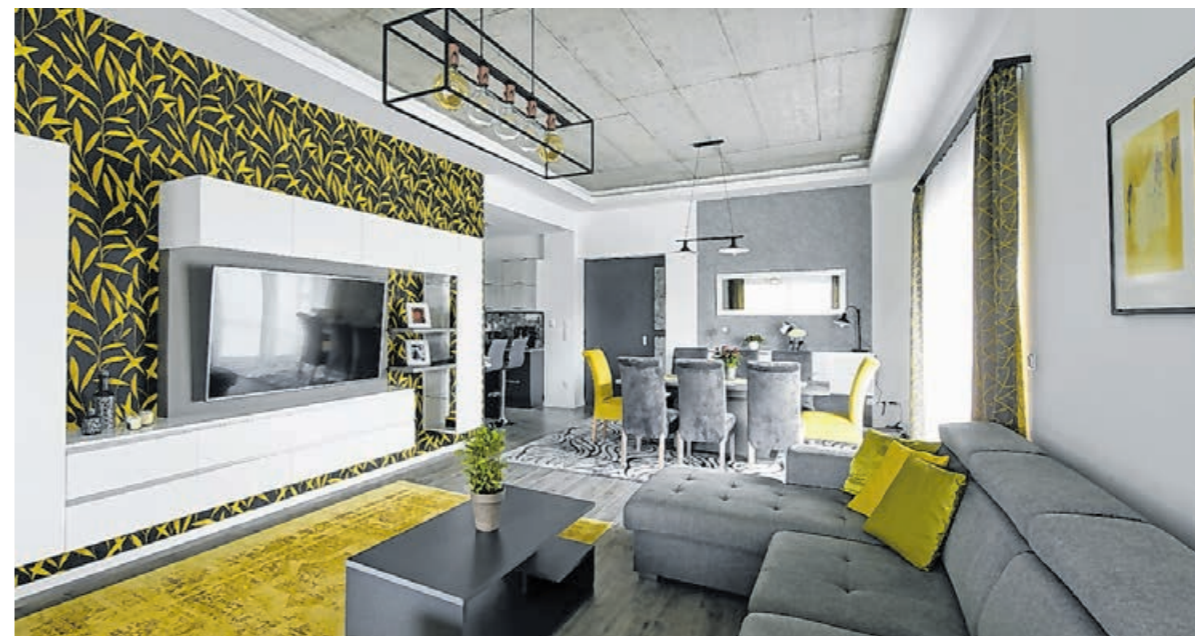
Egy lakás harmóniáját az arányok, formák, színek és a világítás összhangja adja