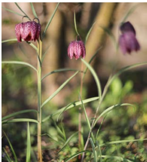
Kíméljük a növényeket, a gyönyörű vadvirágokat semmiképpen ne szedjük le