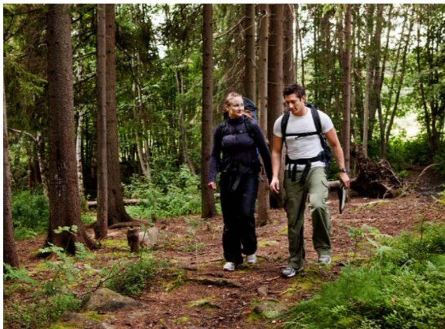
A turistautak esetében is igaz, hogy úgy kell azokat járni, használni, hogy lehetőleg csak a lábnyomunkat hagyjuk ott, semmi mást