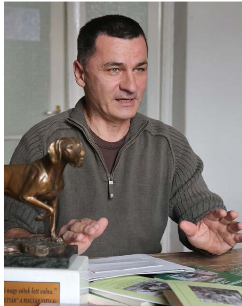
Kertész Sándor szerint a magyar vizsla az egyik legintelligensebb élőlény

Sándor a magyar vizslát választotta, és ez a választás örök. Már a régi öregek is úgy tartották, hogy ez igazából nem is kutya, ez magyar vizsla. A gyűlölet, az önzés, a hatalmi vágy, a nagyra törés mind emberi tulajdonságok. Nagy kérdés, hogy ki lehet ölni az emberekből? Aligha. Viszont a magyar vizsla az egyik legintelligensebb élőlény és ilyen tulajdonságokkal nem rendelkezik. Nincs az egész földkerekségen hűségesebb ennél a kutyánál.