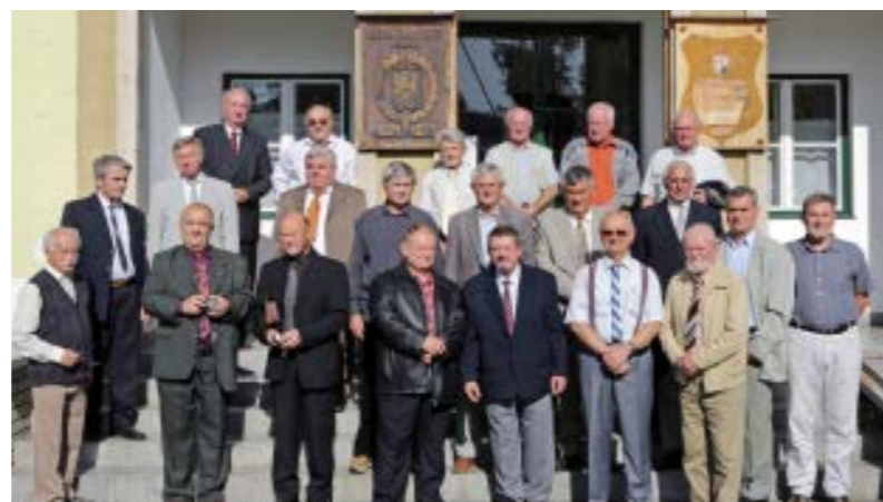
Elhatározták, hogy öt év múlva újra találkoznak

– Sok mindent adtak nekünk azok a körmeniek évek. Lehet, hogy néha nem jártunk be az előadásokra, kocsmázás is előfordult, de mindannyian elkötelezettek voltunk a mezőgazdaság iránt. A képzés magas színvonalának köszönhetően érdekes helyzetbe került a generációk. Ugyanis mi jelentettük az új magyar mezőgazdaság ifjú szakembereit. Állami gazdaságok és szövetkezetek vártak ránk. Magyarországon nem volt soha élelmiszerhiány, ami az iparszerű kukorica-termesztési rendszernek volt köszönhető, amit tulajdonképpen mi tudtunk felkészülten működtetni. Már nyelve-