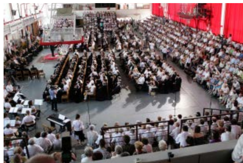
A református zsinatnak is helyt adott a sportcsarnok

színvonalasnak nevezhető sportcsarnok. Azóta sok idő eltelt. A hőskorból aranykor lett... Most nincsen