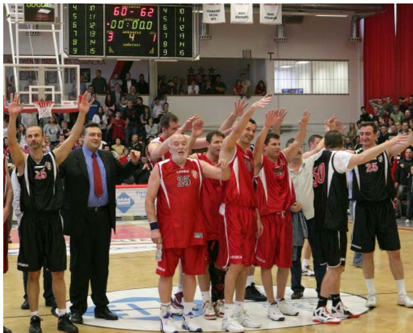
A körmendi kosárlabdaklub 1962-ben alakult. 2012-ben az 50. évfordulót ünnepelték az egyesület egykori és jelenlegi játékosai és sportvezetői

– A hőskorban hihetetlen küzdelmet folytattunk a létért. Kezdetben vörös salakos, aztán bitumenes pályán tudtunk játszani. Ide sorolható a Rába-parti döngölt pálya is. Aztán jött a Gangó, a legendás helyszín, ahol a falra felfestették a játékosokat. Az ablakokat be kellett fóliázni, mert a galambok berepültek volna. A terem nem volt leparkettázva. Ez a mostani színházteremben, a kastély mellékepületében volt. Amikor