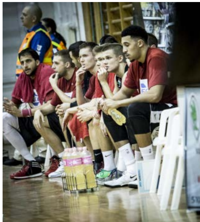
Tanácsalanság a körmendi kispadon