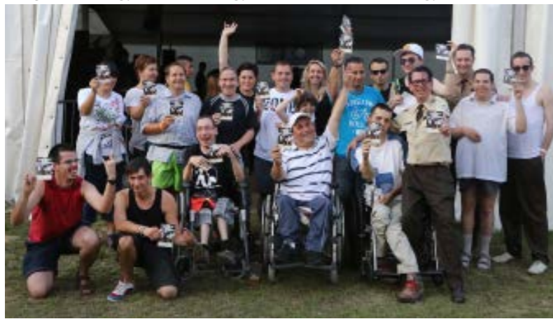
A szociális ellátást igénylők rendszeres résztvevői a városi programoknak.