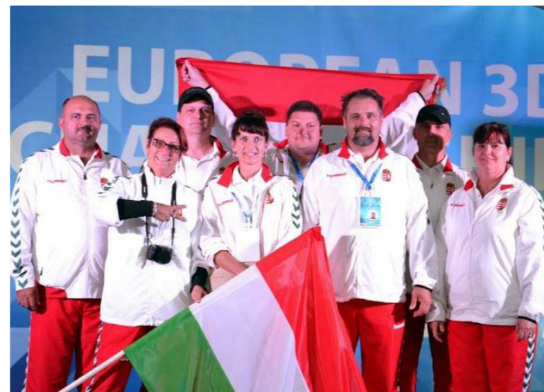
A magyar csapat kiemelkedően szerepelt a tallinni Európa-bajnokságon

csak ezután következett, fokozódtak az izgalmak: a nyolc közé 12 célra, egy-egy lövéssel kerültek be, itt már kieséses rendszer van, nem viszik tovább az eddig megszerzett pontokat. Majd négyfős csoportokban (ha lehet, azonos nemzetből valók nem alkotják a csoportot) folytatták. Még aznap a legjobb négy közé jutásért 8 célra egy-egy lövéssel lehetett bekerülni. A legjobb négy elődöntőbe ment. Az első a negyedikkel, a harmadik a másodikkal párban,