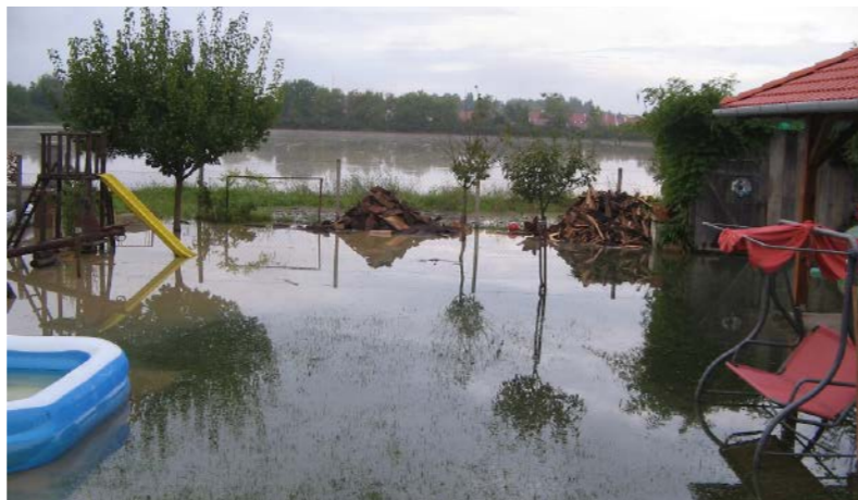
Igy nézett ki a Hunyadi út környéke

- A szakemberek számításai alapján elvették ennek lehetőségét, ugyanis a meglévő vízmennyiség akkor a Képuti ligetet veszélyeztette volna, ahol lényegesen több lakóház kerülne a víz alá.