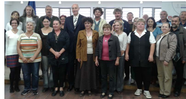
A helyi termelőket a városházán fogadták és tájékoztatták őket a liktáriummal kapcsolatos tervekről.

A tájékoztató végén mind a város, mind a kistermelők részéről meg erősítették: a jövőben szorosabban fűzik kapcsolatukat. ■ KG