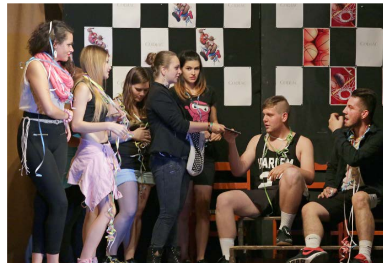
A közönség hosszú ideig ünnepelte a szereplőgárdát.