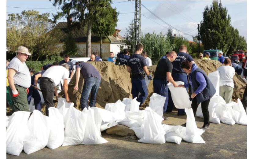
A védekezésben részt vettek a katasztrófavédelem, a rendőrség, az önkormányzat, a polgárőrség és a város lakói.

rófavédelmi Igazgatóság munkatársai, a Körmenti Rendőrkapitányság állománya, az Őrség Mentőcsoporth, a Körmenti Rendészeti Szakközépiskola tanulói, a készenléti rendőrség, az önkormányzat, a járási hivatal, a városgondnokság,