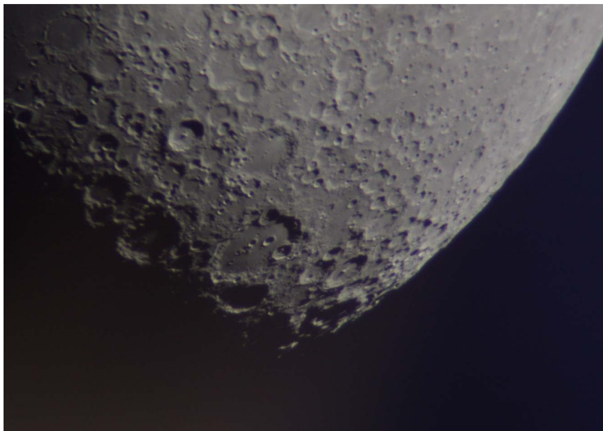
A Hold egyik legszebb része a Clavius kráter és környéke. Nevét a jezsuita matematikus és asztronómus Christophorus Clavius (1537/1538–1612) után kapta. A kráter átmérője 225 kilométer, különösen érdekes a nagy kráteren belül a körív mentén elhelyezkedő, fokozatosan egyre kisebb kráterek láncolata. Korábban ezt a jelenséget előszeretettel magyarázták vulkanikus eredettel — ma már azonban ezekről is kiderült, hogy becsapódások nyomai a holdfelszínben. A Clavius kráter nevét a kultúrtörténetben is jegyzik: Arthur C. Clarke sci-fi regényében és abból készült filmben, a 2001: Űrodüsszeia címűben a Clavius kráterben található az azonos nevű holdi állomás. A történet szerint innét startolt el az az expedíció, amely kiadta Tycho kráter monolitját.