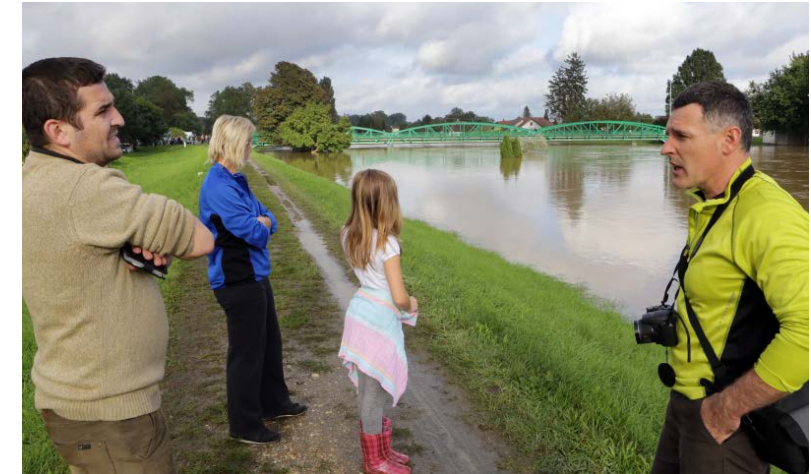
Szeptember 14-én 490 centiméteren tetőzött a Rába, harmadfokú volt a készületség.