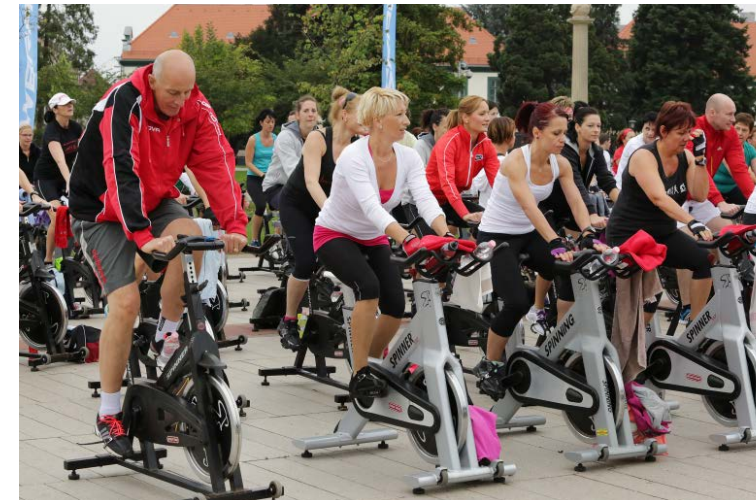
Bebes István polgármester is nyeregbe pattant.