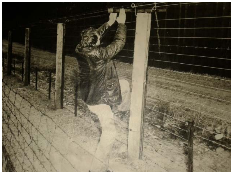
Sokan a szöges dróton való áthatolástól sem riadtak vissza