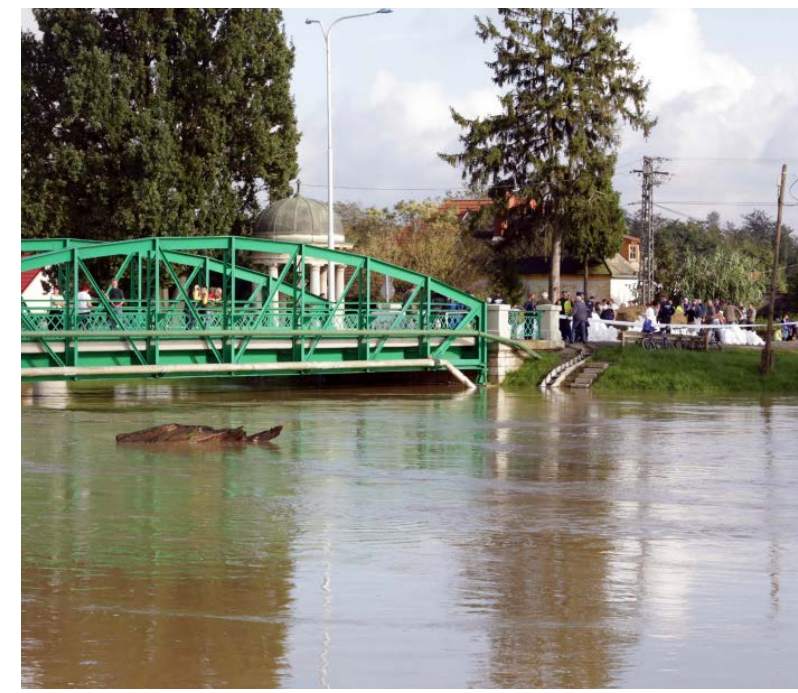
Az idén már ötödször áradt meg a Rába.