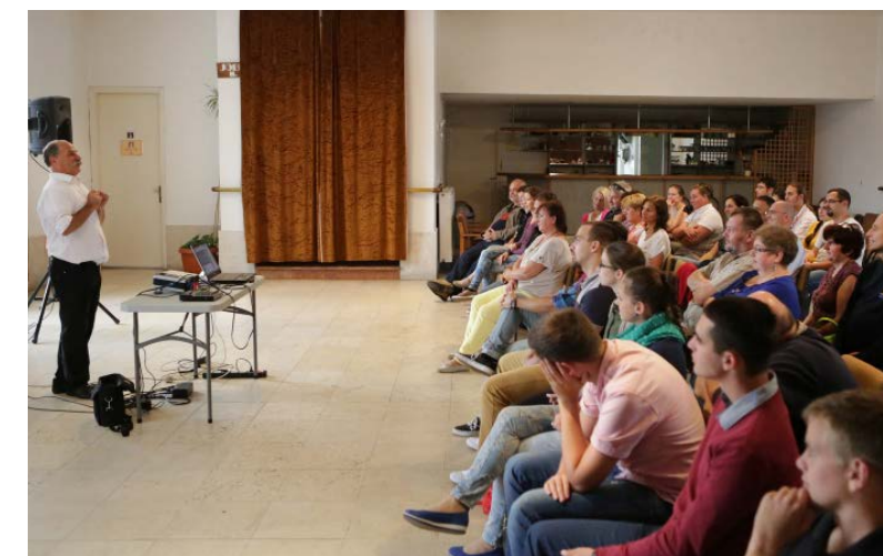
A körmendi közönség élményekkel gazdagodva térhetett haza.

- Jó meséből nem árt, ha sok van. De van egy hírem a szülőknak: a válogatást nekik kell elvégezni. Azt ajánlanám, hogy előbb a meséket olvassák el maguk, aztán adják tovább gyermekeiknek. A korábbi időkben ugyanis a mesék felnőtteknek szóltak, telis-tele tündérekkel, varázslattal, boszorkánnyokkal. Csak később kerültek azok a gyerekek szintjére, mert ugye amit a felnőtt nem ért, azt odalöki a gyerekeknek. Rossz meséből olyan nagyon sok van, hogy a szelektálást nem lehet a gyerekekre bízni, mert az élet rövid ahhoz, hogy a rosszat megismerjük, miközben annyi jó és pompás dolog van benne. Elsőként én mindenképpen a népmeséket ajánlanám. Ha azoknak a végére érünk, nem árt megismerni más népek meséit, különösen a kizsolt és kazah meséket Buda Ferenc fordításában. Magam is érdeklődöm más népek történeteire, énekeire. A számítógépet jobbra íróknak használok, de a gyerekekkel a youtube-on is gyakran körülnézünk, a napokban török és macedón dalokat hallgattunk. Na mármost, visszatérve a mesékre, én azt mondom, hogy végül, persze nem utolsóként Lázár Ervint ajánlanám. Ő kikerülhetetlen. Amire meg ezeken az időkben ugyanis a mesék felnőtteknek szóltak, telis-tele tündérekkel, varázslattal, boszorkánnyokkal.