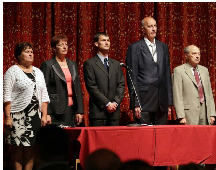
A Tanérvnyító a Himnusz hangjaival kezdődött.