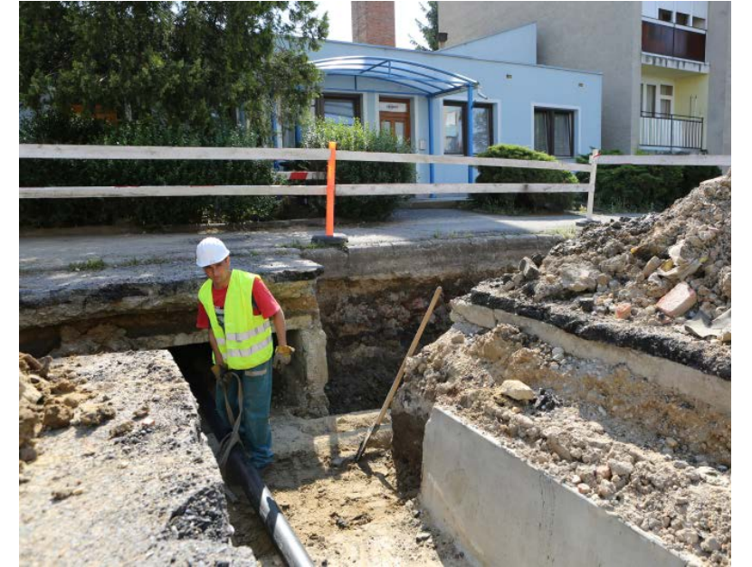
A projekt keretében az előregedett csöveket mind kicserélték.

A RÉGIÓHÓ Kft. által üzemeltetett távhőrendszerek korszerűsíté-