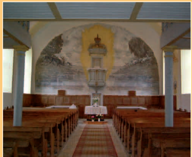
Református templom (1786)