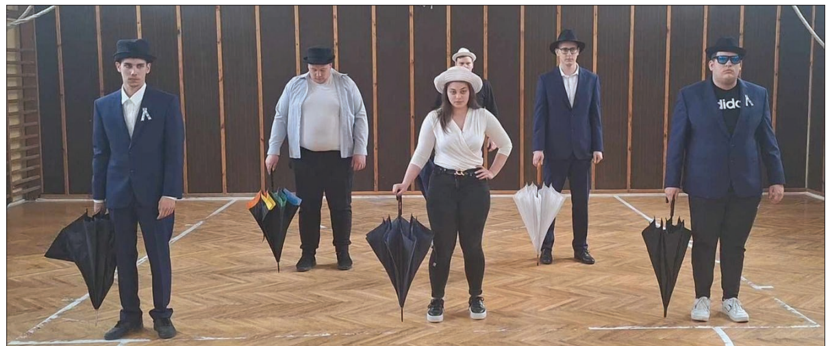
A csapatoknak összesen 26 feladatot kellett megoldaniuk, a körmendieknek idén először vettek részt a versenyben

kot kellett készíteniük és bizony küldetéseket (alapanyag, aláírás beszerzése, tojás eladása) éjjel kellett megoldaniuk. Az, hogy végül milyen helyezést értek el a rázsósok, egyelőre még nem ismert. A győztes nyerevénye a csapatok nevezési díjait rejtő kincsesláda lesz. ■ RV