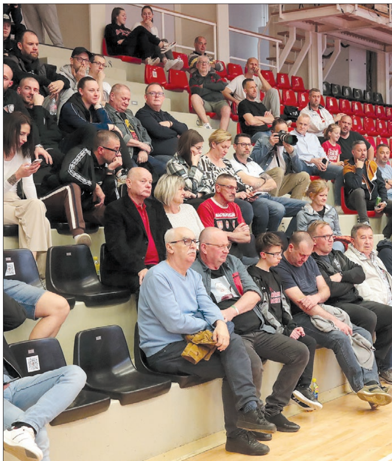
A szurkolók elvárták az egyenes beszédet a csapat helyzetével kapcsolatban