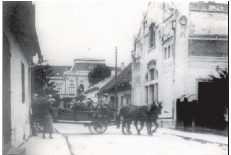
Az Orion mozi