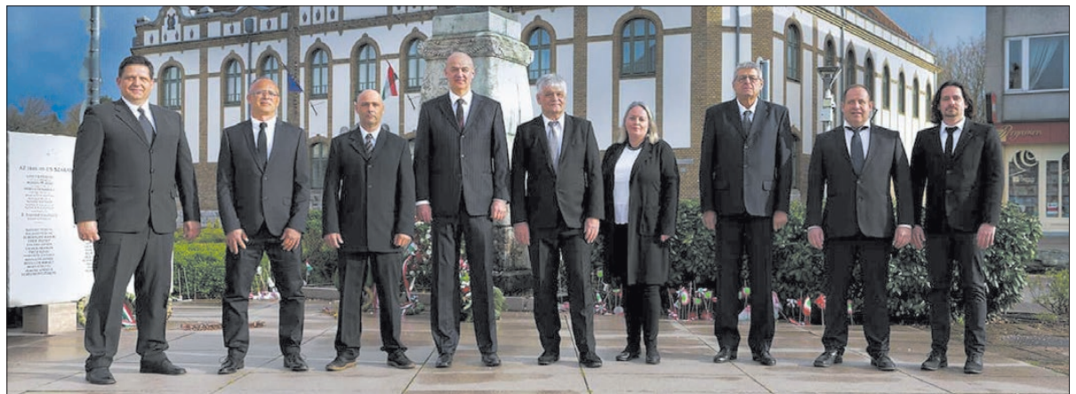
Változást a Városért Egyesület színeiben induló jelöltek