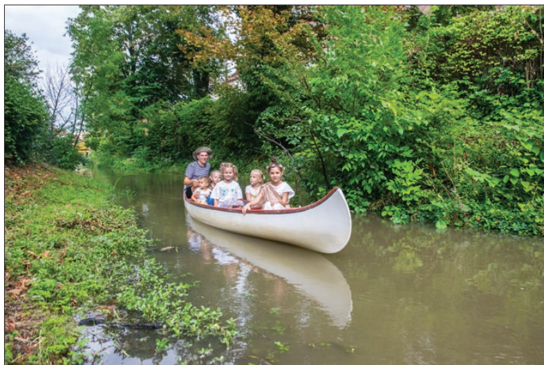
Felejthetetlen élmény egy rábai kajakozás