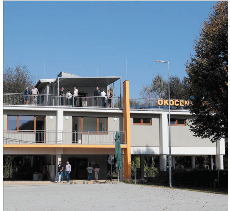
Két pályázat is érkezett az Ökocentrum üzemeltetésére

Bebes István elmondása szerint az új létesítménynek is köszönhetően újra élővé tudják tenni a Rába-partot. Ráadásul ez a beruházás a folyó mentén fekvő települések kapcsolattartásában, együttműködésében is szerepet kaphat. ■ MW