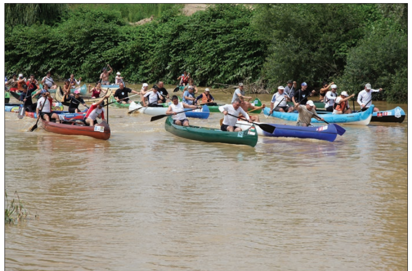
Nagy népszerűségnek örvend a Rába Lapátolás viadal