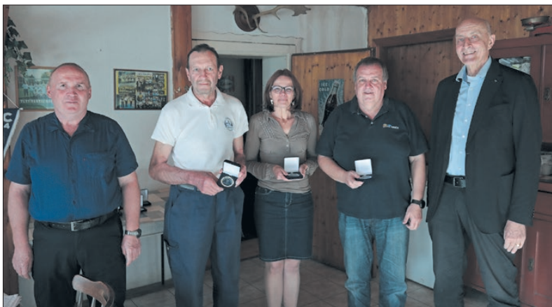
Kitüntetők és kitüntetettek