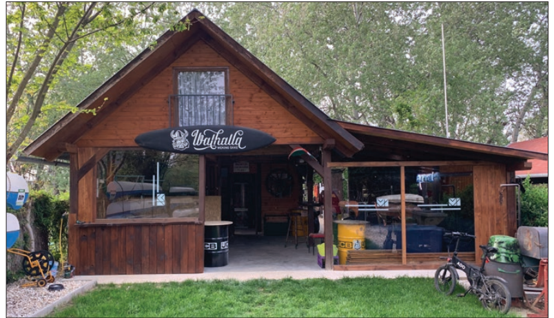
A Walhalla az egyesület otthona lesz

A WeKing Egyesület aktív tagja a MAVITUSZ-nak (Magyar Vízitúra Szövetség) és az MKKSZ-nek (Ma-