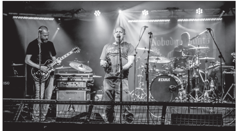
Az egyesület tagjaiból több zenekar is verbuválódott

Az egyesületnek a sport mellett van egy kulturális „arca” is, tagjaikból már több zenekar szerveződött, amelyek folyamatosan koncerteznek, mint például a FeelGood, Gudinaf, River Runners, WildFlower, Benjamin Button. Ez utóbbi a Walhalla megnyitón egy akusztikus formációban lép fel. ■ TT