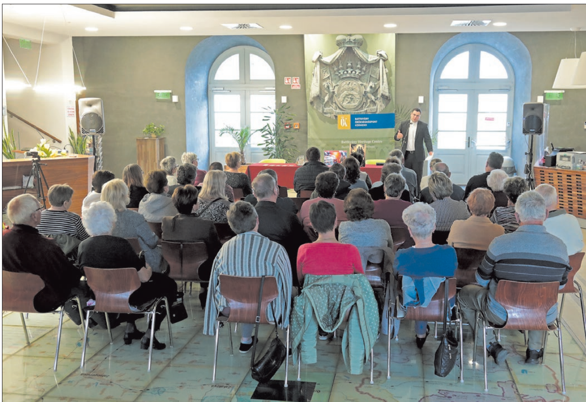
Az érdekesítő előadásra sokan voltak kíváncsiak