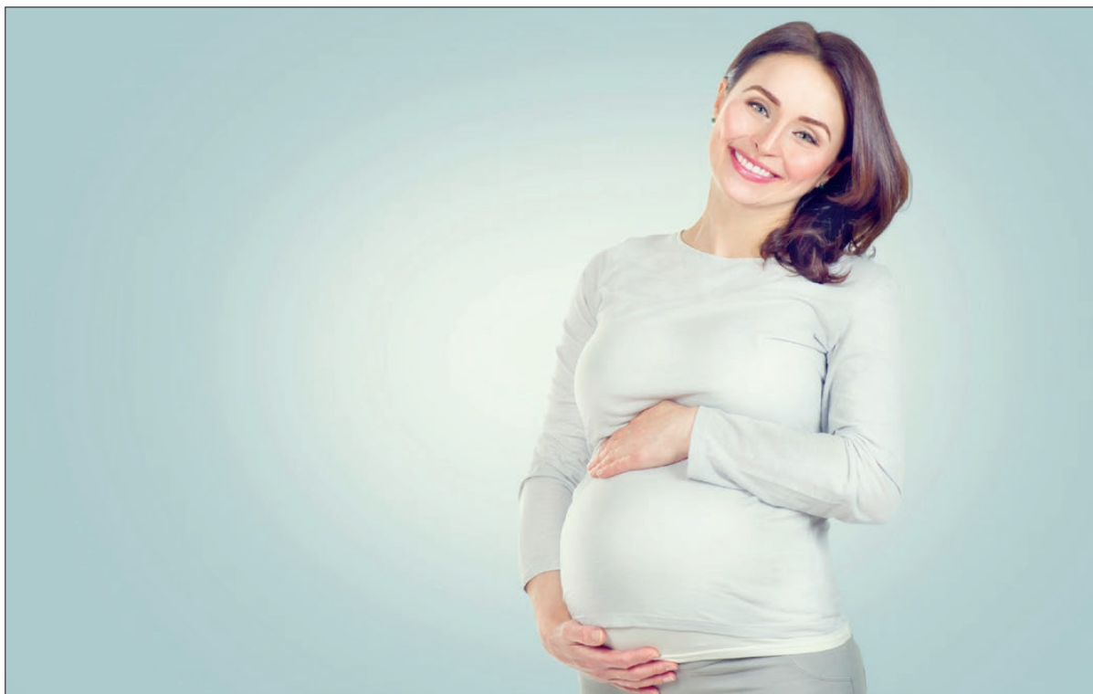
Az édesanya életkora befolyásolja a fogantatáskor kialakuló genetikai rendellenességek kockázatát