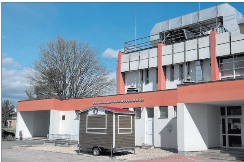
Hétfőtől ismét élettel telik meg a tanuszoda