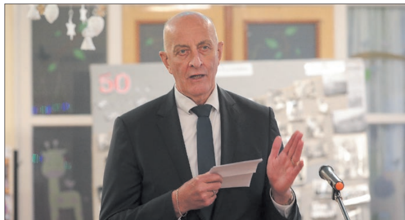
Bébes István polgármester méltatta a fejlesztés jelentőségét