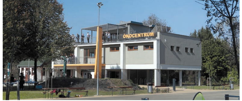
A város életében az egyik fontos fejlesztés volt az Okocentrum elkészülte

– Ami pedig az önkormányzati épületek és intézmények felújítását illeti: szinte minden lelakott állapotban volt. Igaz volt ez a mozira, avagy a színházra, de a Rába-partján is nagyon rossz állapotok uralkodtak. Ma már szinte rájuk sem lehet ismerni. Az újjávarázsolt mozi minden valószínűség szerint áprilisban adjuk át. Aztán szépen folyamatosan, évekre lebontva a közoktatási intézményeket is felújítottuk: iskolákat, óvodákat modernizáltunk. Megpróbáltunk minden munkát a lehetőségeinkhez képest elvégezni. Emellett