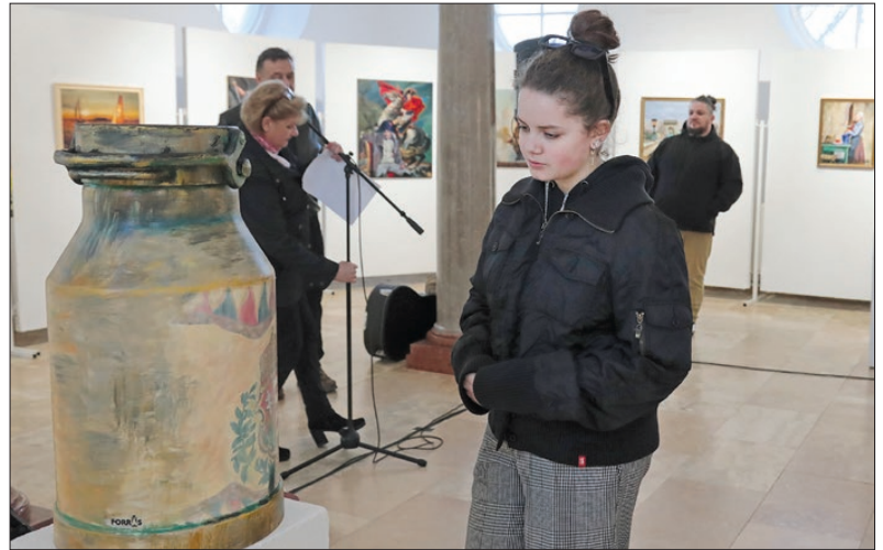
Nem biztos, hogy a fiatalok felismernek a tejeskannát