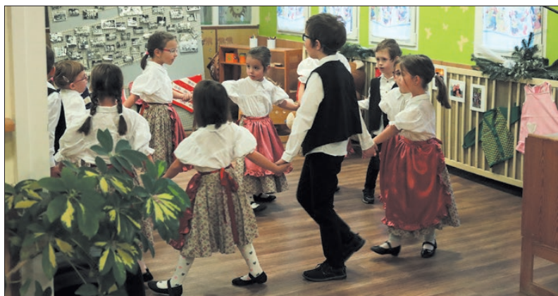
12 férőhelyes csoportszobával bővült az intézmény

– A kisgyermek életében a bölcsőde az első olyan intézményi közege, ahol az otthonuk után a legtöbb időt töltik, ezért elengedhetetlen, hogy itt – a csoportban, a fürdőszobában, az átadóban, az udvaron – biztonságban, kényelmesen érezzék