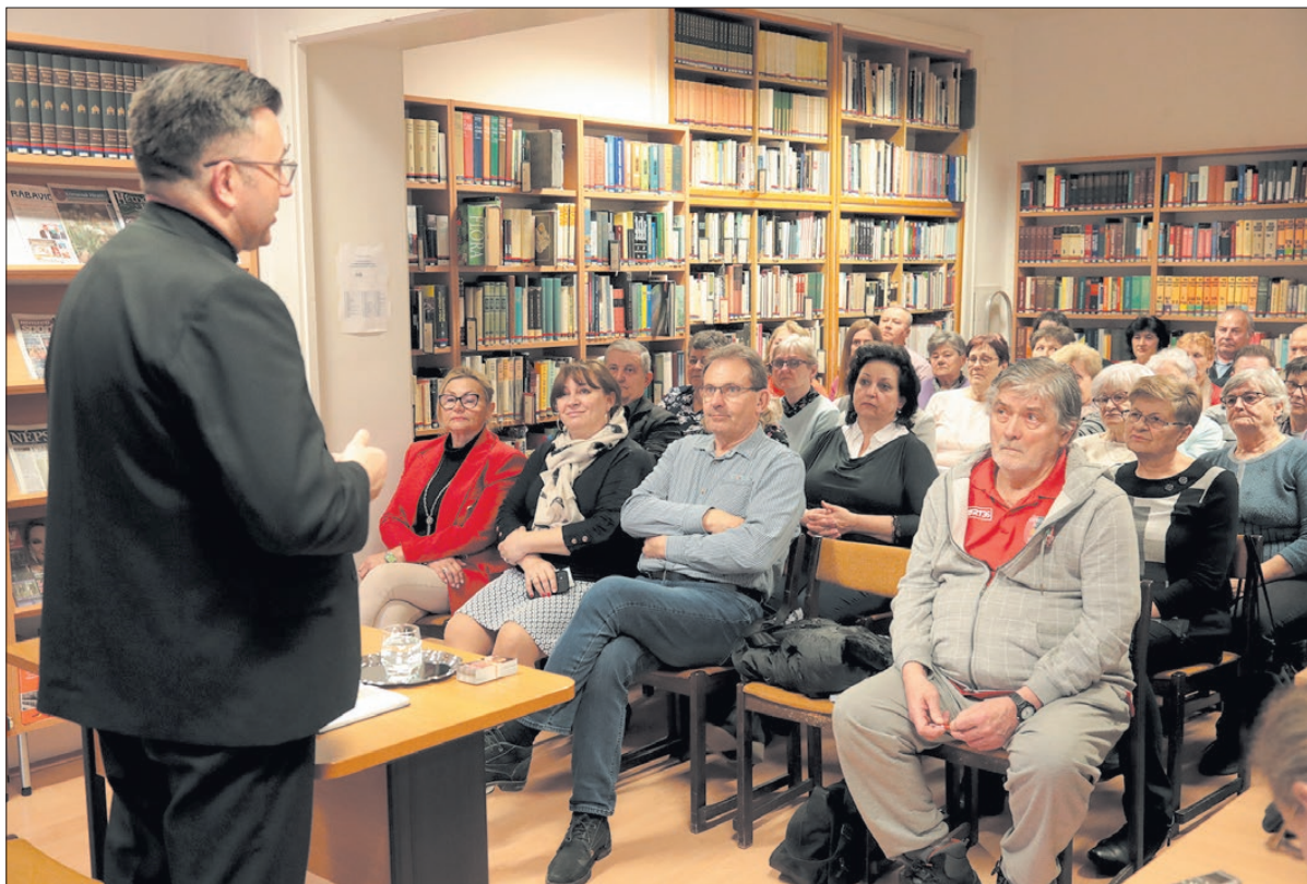
Élénk érdeklődés kísérte a KÉSZ körmendi szervezetének az eseményét