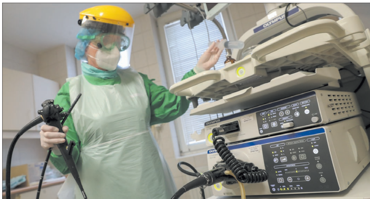
Minden harmadik emberben található polip