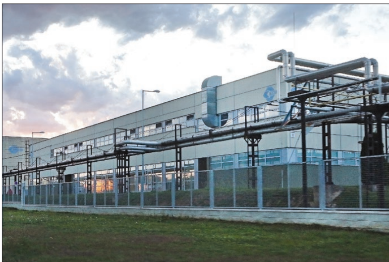
A vállalat egykor kiemelt termékei, a tejalapú tápszerek gyártására létesítette új telephelyét