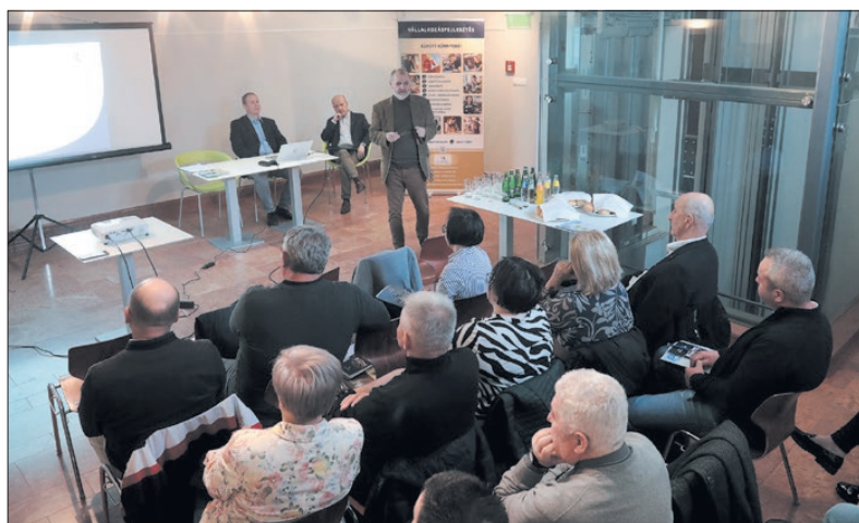
A gazdaságfejlesztés lehetőségeit járták körbe a résztvevők

kamara tavalyi útjára indított egy gazdasági road show-t, amelynek az volt a célja, hogy helyben, az adott település vagy térség vállalko-