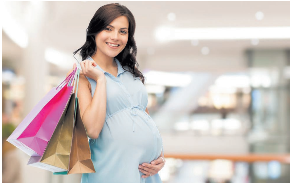
Hazánkban ma már minden ötödik kismama tudja, hogy fontos a rendelkezésre álló legkorszerűbb vizsgálatokat igénybe venni