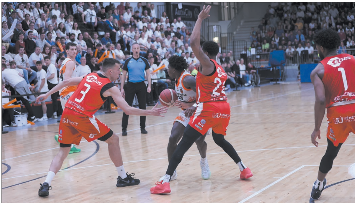
Az alapszakasz zárómérkőzésén az Egis Körmend kikapott az NKA Universitas Pécs csapatától

A pécsi meccs volt az utolsó dobása az Egis Körmendnek, hogy biztosítsa magának a rájátszást, azaz a legjobb nyolcba kerülést. Az előjelek ezúttal sem a vasiaknak kedveztek, akik immár négy meccse nem tudtak nyerni. Ettől függetlenül most tényleg csak a győzelem jöhetett szóba, azonban nem hozta el a várt feltámadást idén a nagyszombat, legalábbis körmendi szemszögből. Az Egis Körmend kosárlabda-csapatja ugyanis kikapott szezonbeli eddigi legfontosabb mérkőzésén, az NB I-es kosárlabda-bajnokság alapszakaszának záró, 26. fordulójában, ezzel eldőlt, hogy hosszú évek után nem szólhat bele a bajnoki címért zajló csatába. A 2014/2015-ös szezont követően kilenc év után nem jutott be ismét az NB I-es férfi kosárlabda-bajnokság rájátszásába a vidék első bajnoka. A vereség