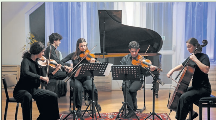
Egymásra talált a kvintett és közönsége