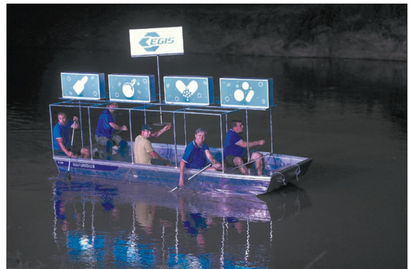
Az Egis a társadalmi felelősségvállalás jegyében több körmendi esemény támogatója