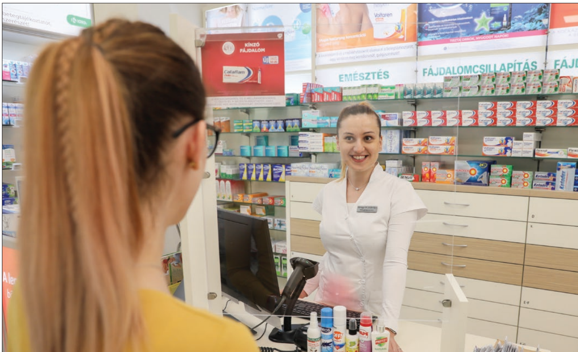
A gyógyszertárakban többféle kullancsriasztó is elérhető

Amikor egy későbbi időpontban egy fertőzött kullancs Önt megcsípi, már védett a betegséggel szemben. Érdemes a védőoltást beadatni minden gyermeknek és felnőttnek, akik akár hosszabban, akár csak átmenetileg fertőzött vidéken tartózkodnak. A kullancscsípéssel járó fertőzések megelőzése érdekében – a védőoltás beadatása mellett – ajánlatos a zárt öltözék, illetve a kullancsriasztók és -irtók alkalmazása is