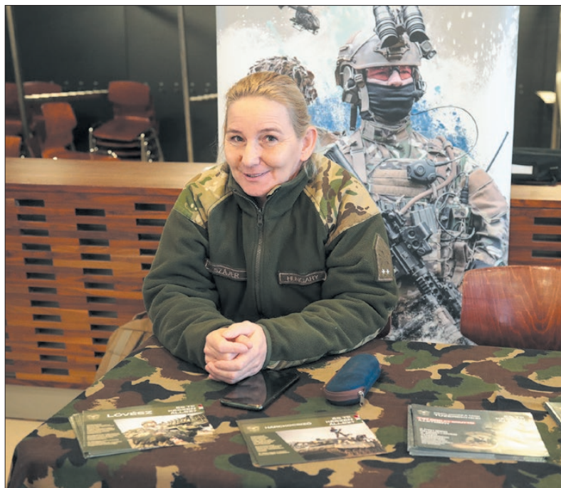
Színes volt a munkáltatói kínálat

A rendezvény mindazon cégeknek, vállalkozásoknak lehetőséget biztosított, akik munkatársakat keresnek akár rövid távon, akár távlatokban. Mindegy, hogy kisebb, vagy nagyobb létszámban terveznek felvételt, közvetlenül találhattak munkavállalót anélkül, hogy a cégen belüli előszűrést kellene alkalmazni, időpont egyeztetésekkel, szervezéssel bonyolítva. Szólt továbbá minden potenciális és aktív munkavállalónak. Munkanélküliek, állást változtatni szándékozók, GYES-ről, GYED-ről visszatérők, pályakezdők számára egyaránt lehetőségeket hordozott az esemény. Egy helyen, egy időben több munkaáltatóval lehetett közvetlen kontaktust teremteni, az ajánlataikat meghallgatni. Aki állás nélküli, az akár azonnal