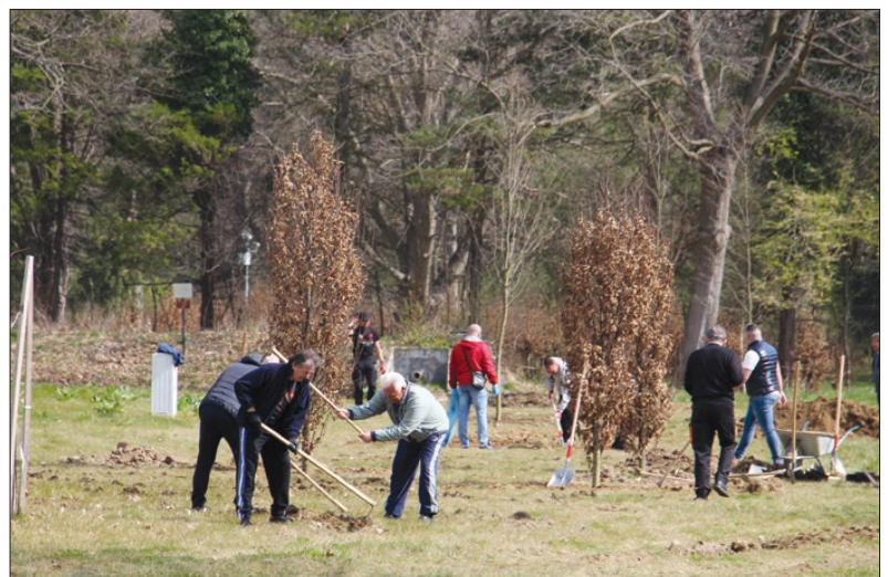
A Polgári Összefogás Körmentért Egyesület faültetése