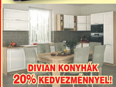
DIVIAN KONYHÁK 20% KEDVEZMÉNNYEL!

A képek illusztrációk, az akció február 29-ig, ill. a készlet erejéig tart.