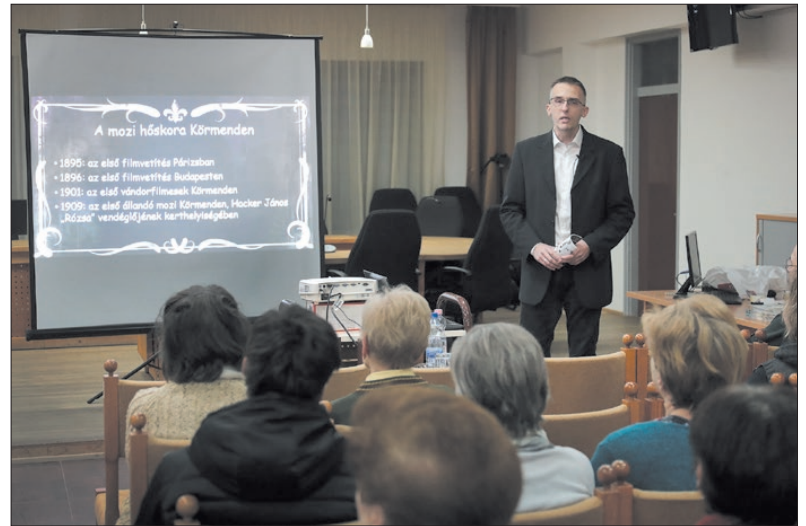
Móricz Péter előljáróban elmondta: a Lumière testvérek 1895. december 28-án vetítették le első filmfelvételeiket Párizsban

Az Apolló 1928-tól Orion éven működött, és hamarosan egyetlen mozi maradt Körmendnek annak köszönhetően, hogy 1932-ben bevezette a hangosfilmek vetítését is, míg ezt az Uránia nem tette meg. Az Orion filmszínház 1931-től a Vármegyei Takarékpénztár tulajdonában állt. Amikor a pénzüzet antiszemita támadások keresztjébe került, 1941-ben eladta a mozi Traub-