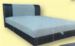
Erősített rugós franciaágyak