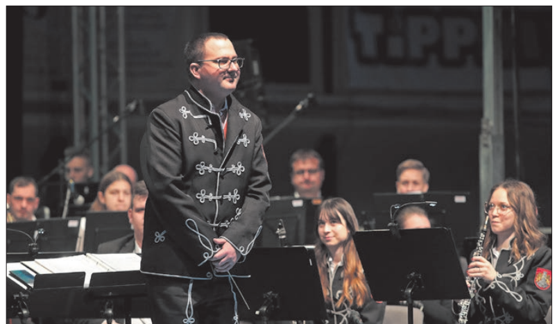
Az ünnepi műsor végén a zenekar elbúcsúztatta karnagyát