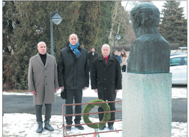
Megkoszorúzták Kölcsey Ferenc szobrát