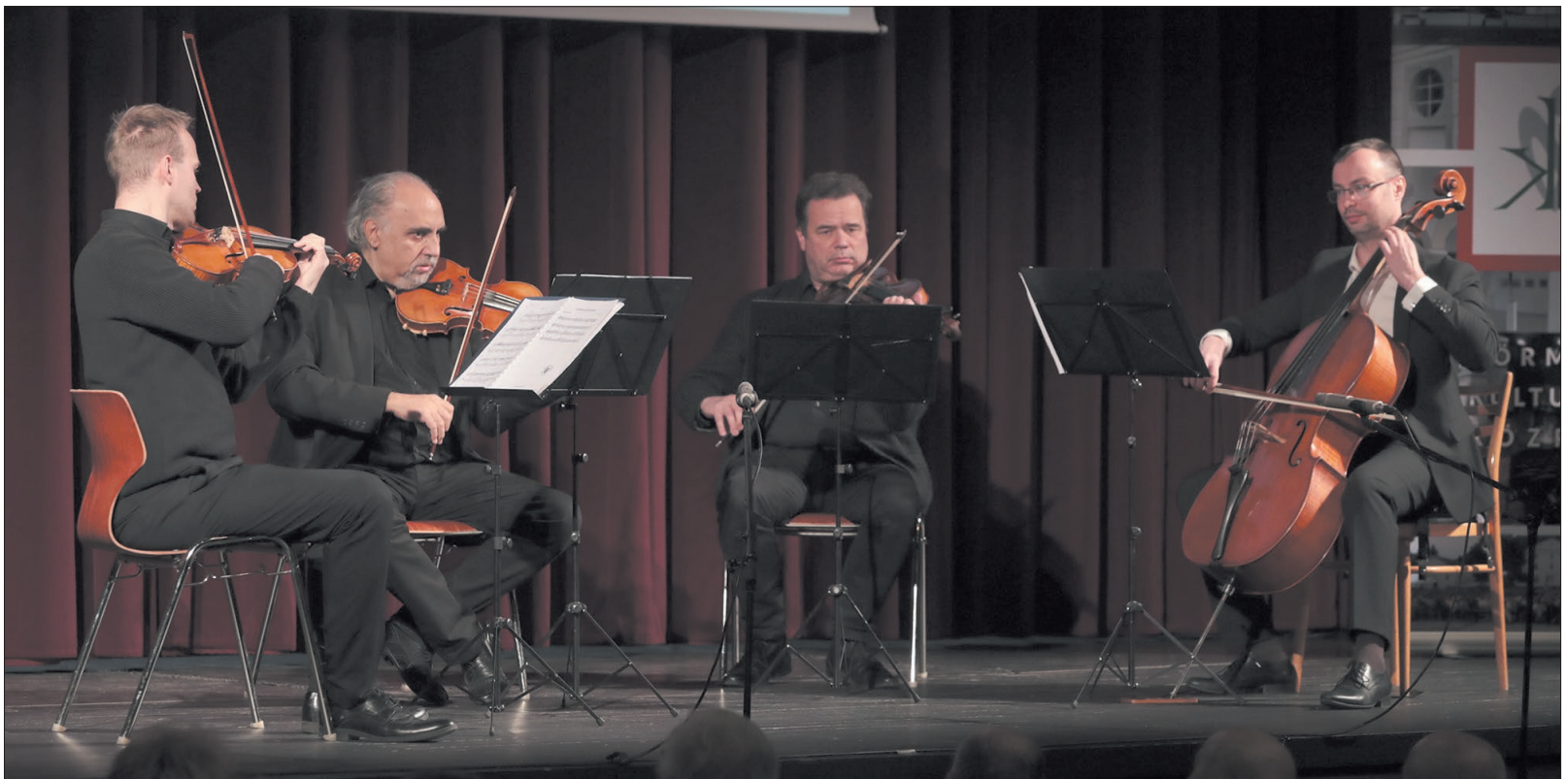
Klasszikus zenei előadást hallhatott a közönség