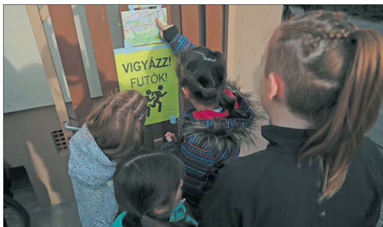
A legkisebbek is lelkesen vettek részt a programon