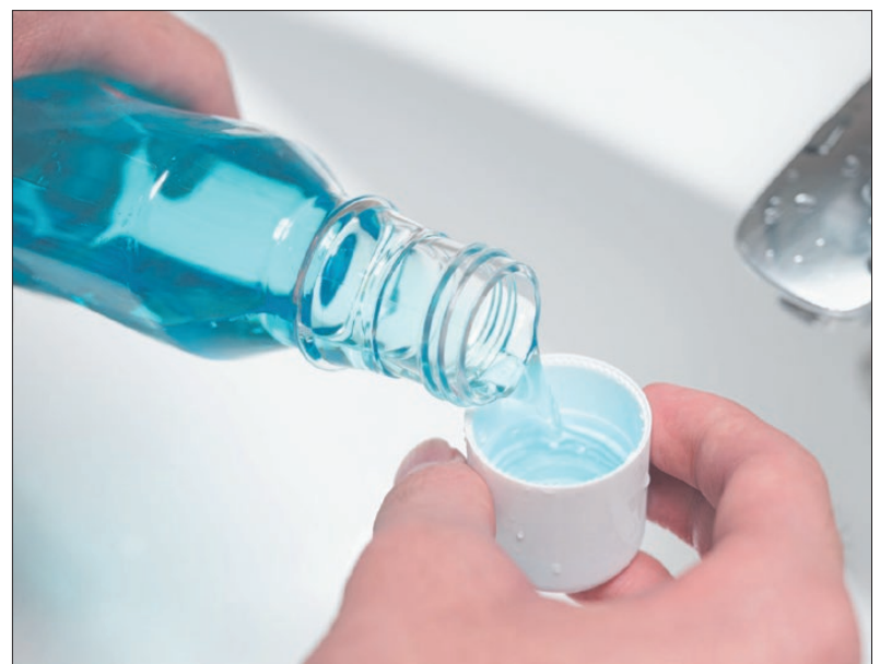
A szájvizet használók esetében 12 százalékkal nagyobb volt a magas vérnyomás kialakulásának valószínűsége