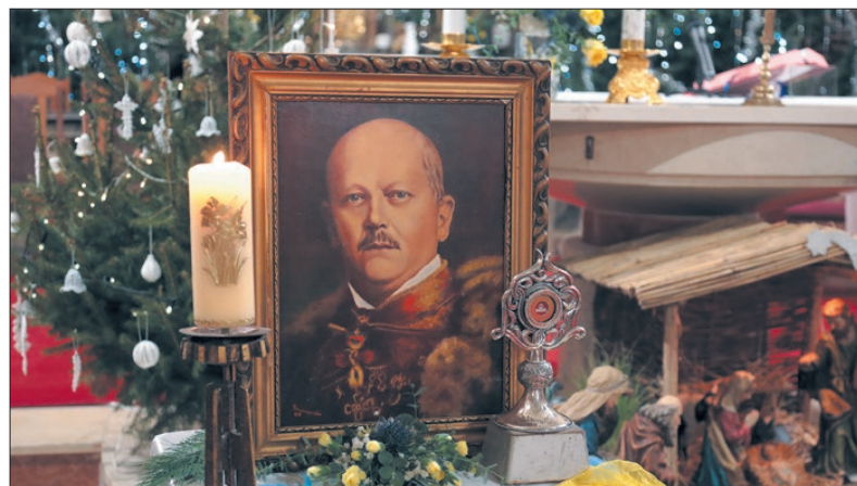
93 évvel ezelőtt hunyt el a hercegorvos