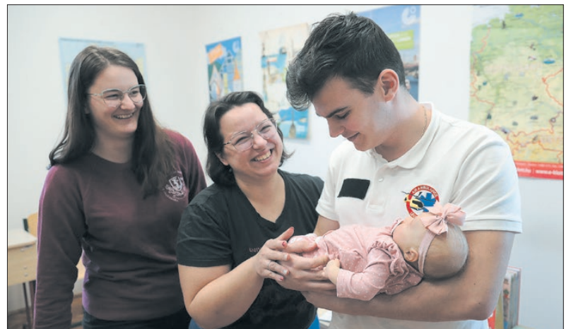
A gimnazistáknak tartalmas tájékozódásra nyílt lehetőségük

helyszíni tájékozódásra. Dacára annak, hogy a pályaaorientációs nap idén közvetlenül az Educatio nevű országos rendezvény kezdete előtt zajlott, a kiállítók száma az előző évekhez hasonlóan magas volt. Az ELTE, a Széchenyi Egyetem, a PTE, a Semmelweis Egyetem, az Állatorvostudományi Egyetem, a Soproni Egyetem, a Pannon Egyetem, a Nemzeti Közszolgálati Egyetem, a Maribori Egyetem, valamint a katasztrófavédelem, a honvédség toborzó irodája is képviseltette magát a rendezvényen, de jelen voltak a Körmendi Rendvédelmi Technikum munkatársai és hallgatói is. A gimnazistáknak tartalmas tájékozódásra nyílt lehetőségük az előadásokon, majd az egyes kiállítók standjainál.