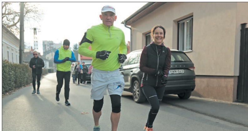
Két táv közül választhattak a futók

tizedekig tanított a Somogyi Béla Általános Iskolában – igazi sportember és maga is nagy futó, nem is beszélve családjáról: a legkisebbtől a legnagyobbig mindenki sportol va-