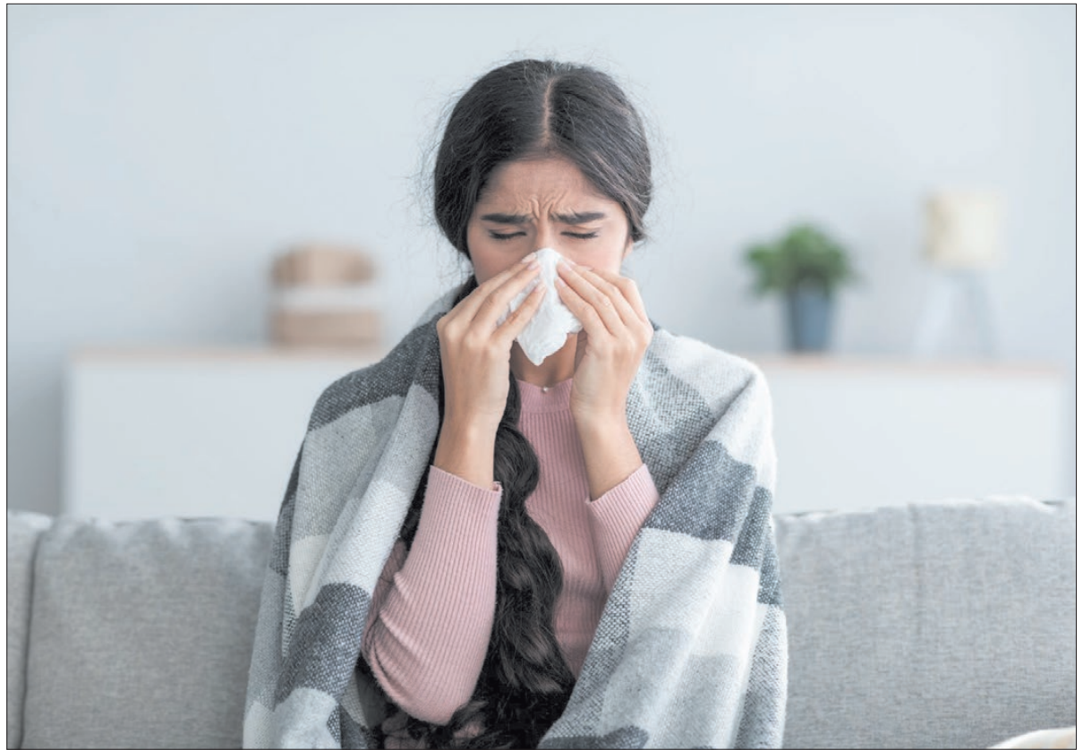
Az orrüreg kiemelt feladata a belélegzett levegő felmelegítése

is. Az érosszehúzó hatású készítményekkel nem árt vigyázni, könnyen rászokhatunk, ezeket egy hétnél tovább nem szabad használni. Érdelesebb a tengervizes orrsprayhez nyúlni megfázás esetén, ezeket a gyerekek is biztonságosan használhatják időkorlát nélkül. life.hu