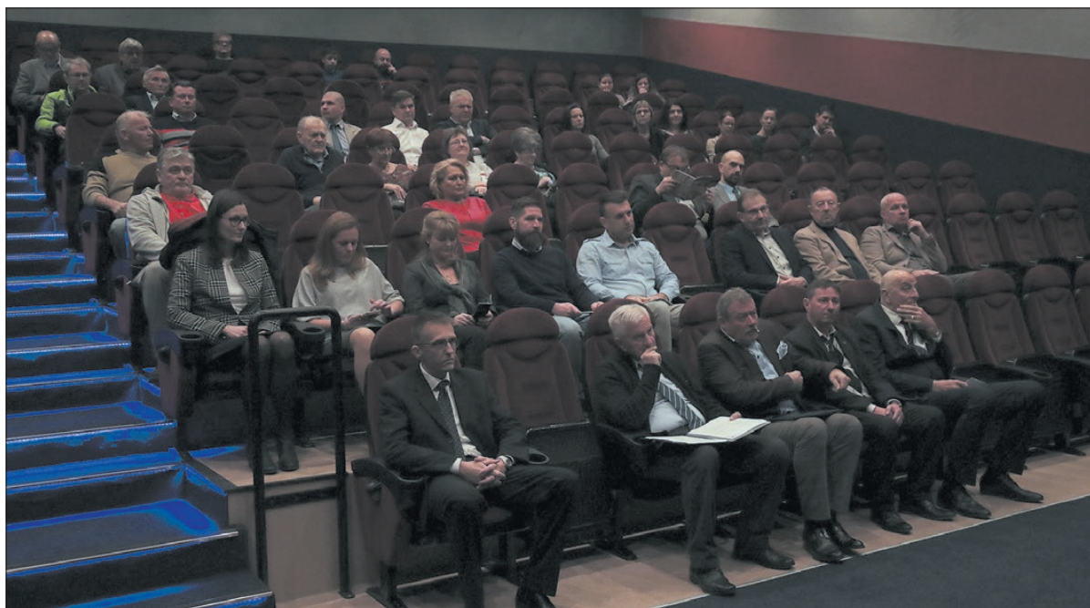
Energetikailag korszerűsítették a mozi épületét