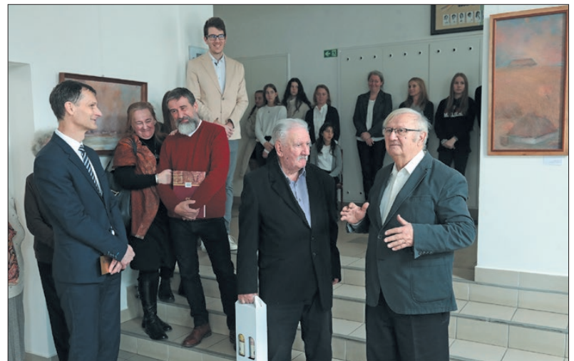
Méltó módon emlékeztek meg