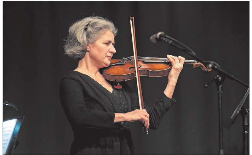
Közreműködtek a Körmenti Alapfokú Zene- és Táncművészeti Iskola tanárai