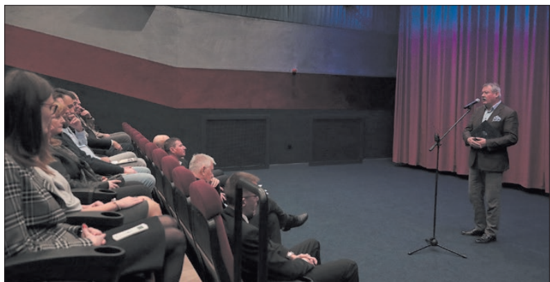
V. Németh Zsolt államtitkár, a térség országgyűlési képviselője a közösgépítésről beszélik

Hosszú előkészítő munka után megújult Körmend belvárosában a mozi közként ismert, igen forgalmas közterület, és maga a mozi épülete is. Az eredetileg elnyert 600 millió forint támogatáshoz további 515 millió forint kormányzati támogatás érkezett, hogy a teljes projekt megvalósulhasson. A kivitelezési munkálatok márciustól november végéig tartottak