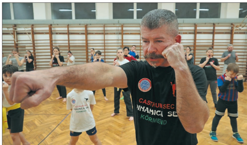
Korábbi sportolók is részt vettek a rendezvényen