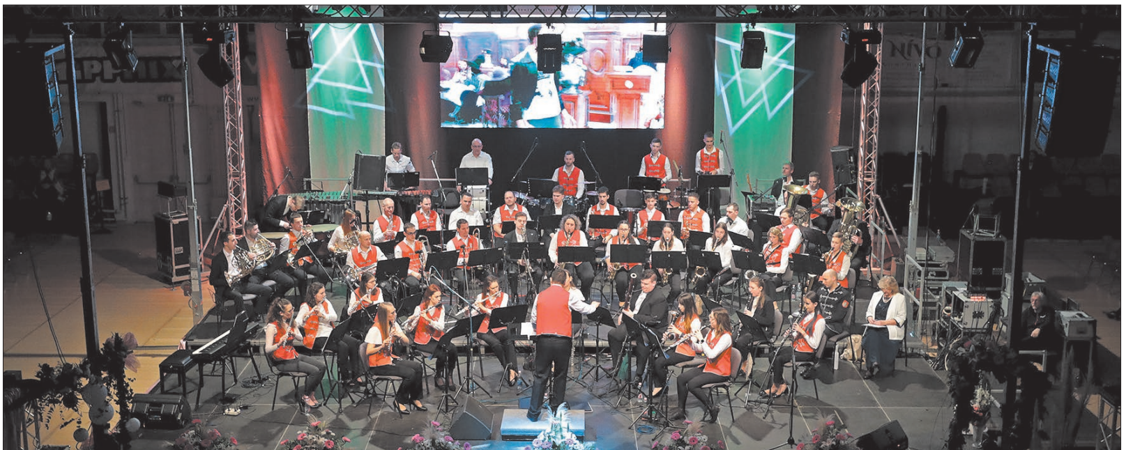
Minden korosztály élvezettel hallgathatta az előadást