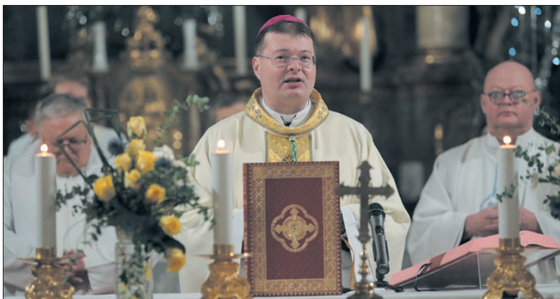
A herceg orvosra emlékeztek

A Martinus újságban öt évvel ezelőtt készült interjú a főorvosnővel. Ebben mondta: a hitemet végig megtartottam. Vallott arról is, hogy cursillot végzett, ami megvál-