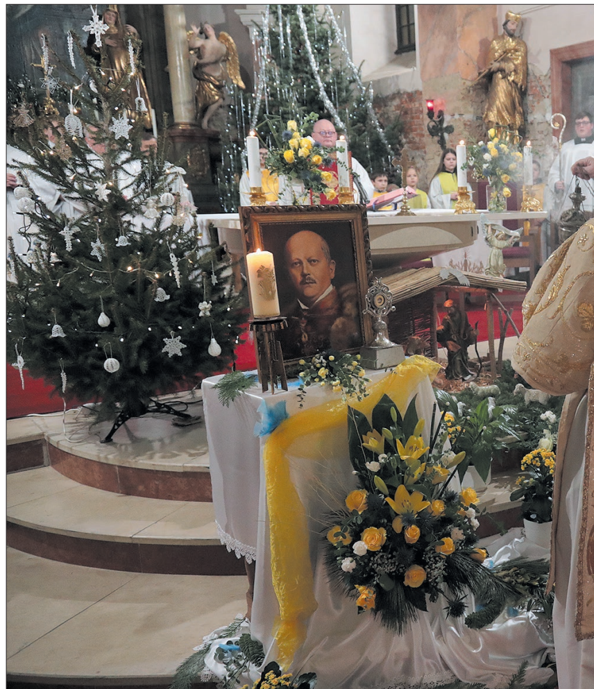
Dr. Batthyány-Strattmann László ars poeticája volt: Csak az lehet boldog, aki boldoggá te