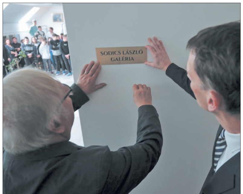
Felkerült az emléket őrző névtábla