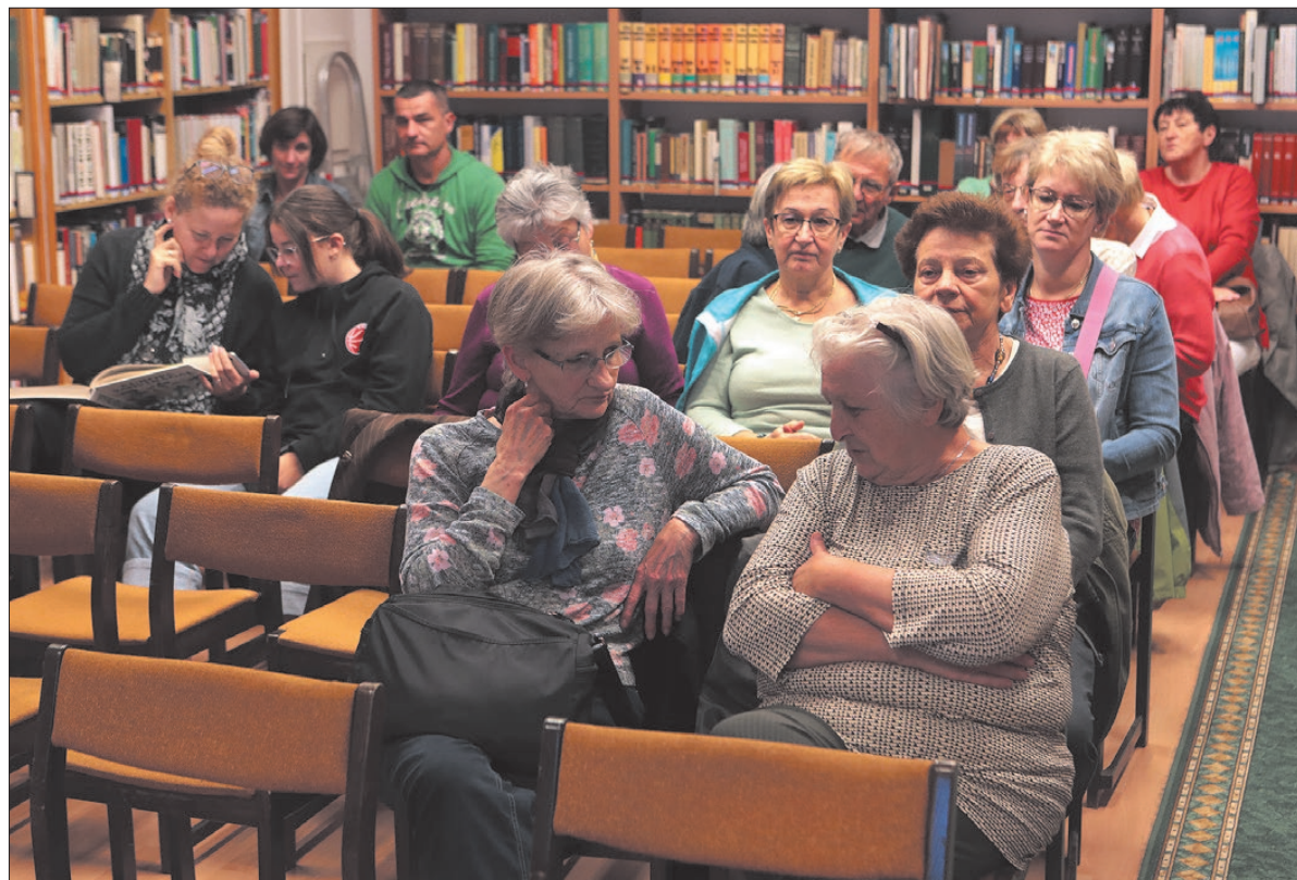
A könyvtári rendezvények idősek és fiatalok számára is érdekesek

Annyit tudunk, hogy utolsó ismert vacsorája 1949. július 30-án a székelykeresztúri Vargha-családnál a Gyárfás-kúrián bivalytejes és túrós puliszka volt. Másnap nyoma veszett a költőnek.