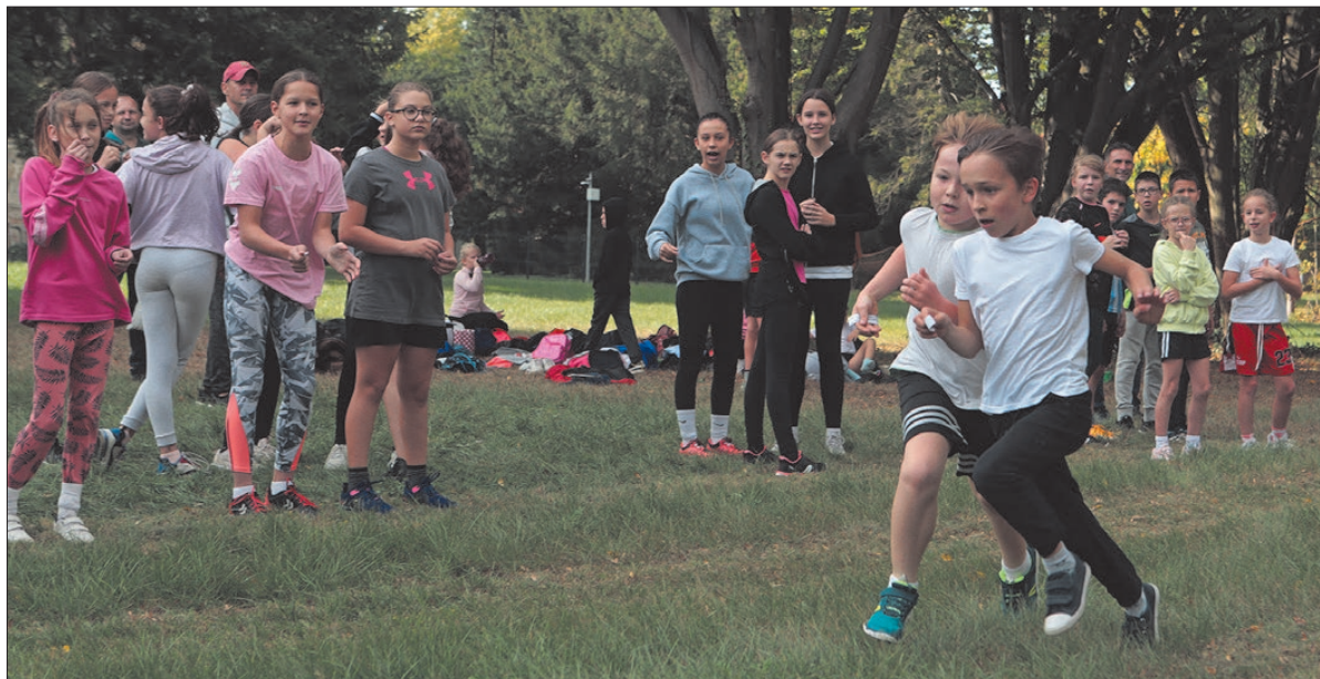
Az időjárás is kedvezett a versenynek