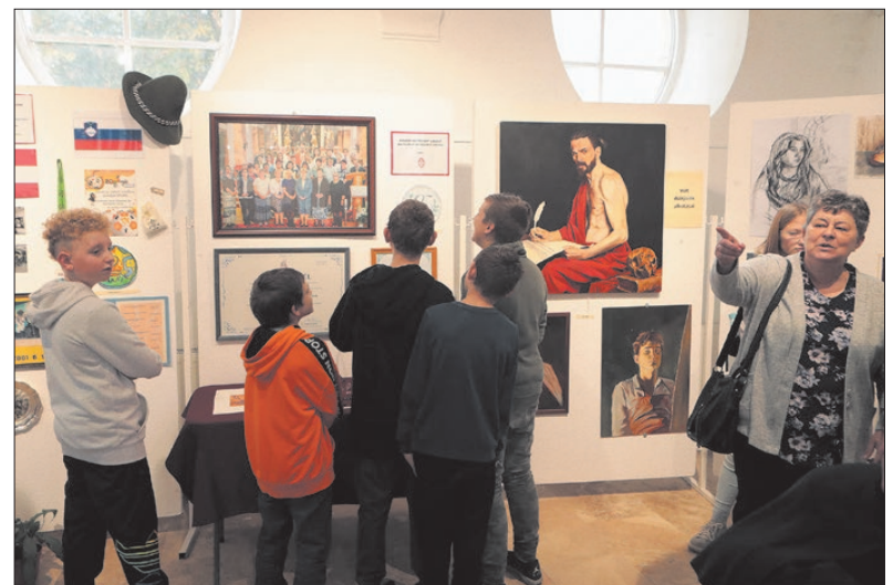
A tárlaton számos különleges darab tűnik fel