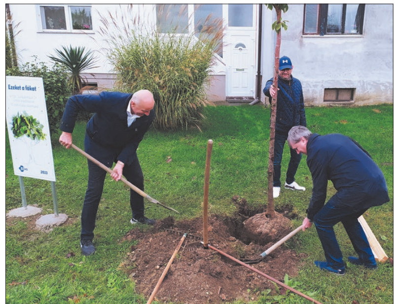
A faültetés apropója az Egis Gyógyszergyár Zrt. alapításának 110. évfordulója volt

A város és a gyógyszergyár közös városépítési kezdeményezéséről a fasor elején emléktábla tájékoztatja a járókelőket. ■ TJ