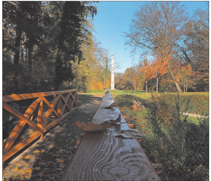
Ideje, hogy tanuljunk újra a természettől

De ha ősz, akkor a faültetésről is érdemes beszélni. Egyre elterjedtebb az őszi faültetés, csak a kevésbé fagyúró fákat ültetjük tavasszal. Ilyenkor intenzív a fában a nedvkerítés, a lombjait ledobta, a tápanyag a gyökerekben koncentrálódik. Facsemete vételenél fontos, hogy egészséges gyökerei legyenek a növendék fának, erre érdemes figyelni. A vétel után meg kell vágdosni a gyökerek végét, majd érdemes vízbe tenni, hogy jól megszívják magukat a vízben. Az ültetésnél arra figyeljünk, hogy bár mutatós a kerek gödör, mi ne ilyet ássunk. A kerek mélyedésben ugyanis körkörös terjed a gyökér, főleg, ha száraz idő van. Inkább szögletes legyen a gödör, a fa gyökere így ki fog nyúlni a sarkokba és azon túl is,