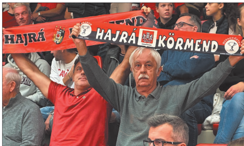
A szurkolókra nem lehetett most sem panasz