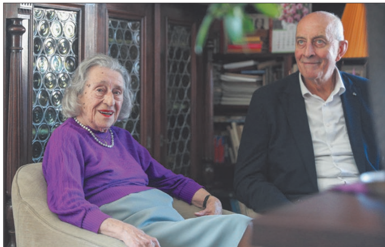
Otthonában köszöntötte a szépkorú asszonyt a polgármester

ta a születésnapján. A városvezető Orbán Viktor miniszterelnök köszöntő oklevelével és egy csokor virággal érkezett az ünnepelt-höz.