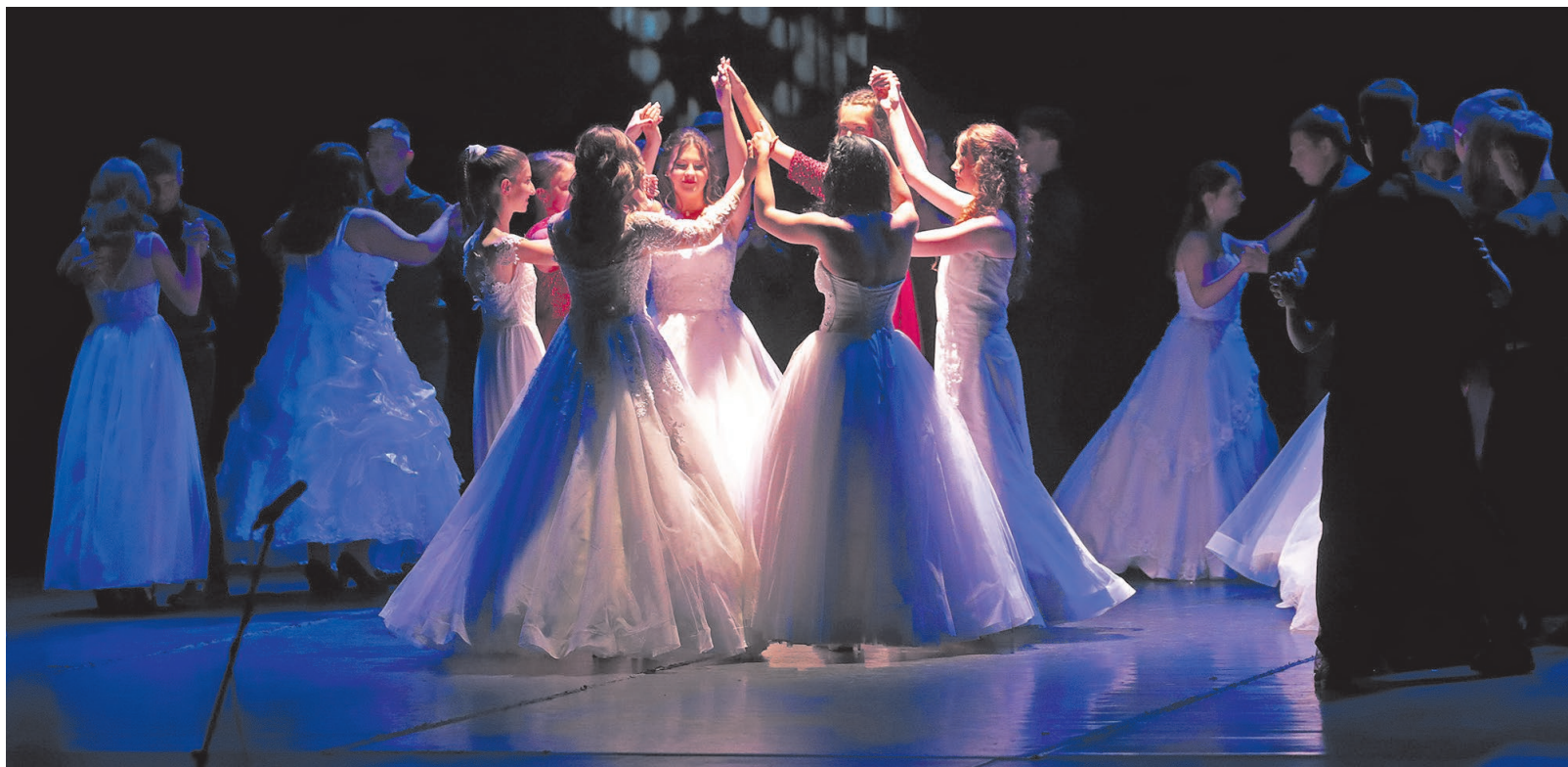
A végzősök hagyományos nyitótánca