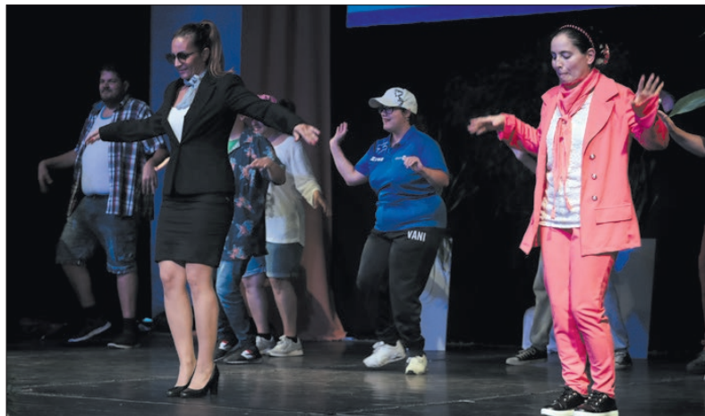
A Szociális Szolgáltató és Információs Központ ellátottjai színes műsorral készültek

Bebes István polgármester beszédében hangsúlyozta: minden település számára fontosak a szépkorúak, mert a jelenkor azokon az alapokon építkezik, amelyet ők felépítettek. Így van ez Körmenden is - tette hozzá.