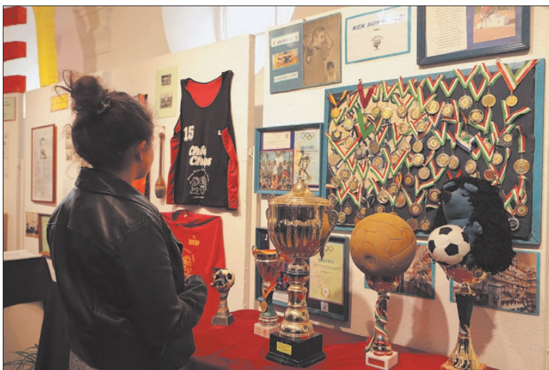
A sportsikereket érmek, kupák egyaránt tanúsítják