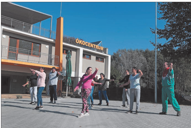
Az átadó után a Körmenyi Szociális Szolgáltató és Információs Központ szervezésében megtartották az I. Boldog Batthyány László Esélyegyenlőségi Napot.

– Azt szeretnénk elérni, hogy a helyiek mellett az ide érkező turisták is ki tudják használni a vízpart, illetve a víz adottságait, és élvezni tudják a csodálatos természeti környezetet. Arra törekszünk, hogy összefűzzük a Felső-Rába mentén lévő településeket. Olyan együttműködést próbálunk kialakítani, amely nemcsak most, hanem a jövőben is szolgálja az embereket. Ennek egyik eleme a körmenyi fejlesztésomag, de úgy gondolom, Szentgotthárdon, Csörötneken és Csákánydoroszlóban is az együttgondolkodást helyezik előtérbe, ennek szellemében készültek el a különféle beruházások a Rába-parton a közelmúltban - zárta szavait a városvezető, aki megköszönte minden közreműködőnek a munkát. ■ TJ