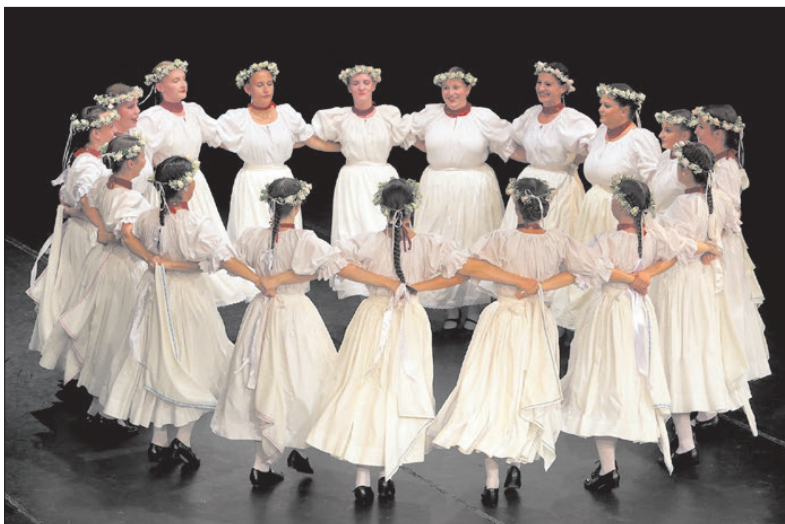
Igazi ünnepi műsort láthatott a nagydíjazott

Kiemelkedtünk a hétköznapokból, ünnep volt. - Nincs is más ünnep, csak a közösségé - Hamvas Béla így mondaná. És milyen igaz lenne.