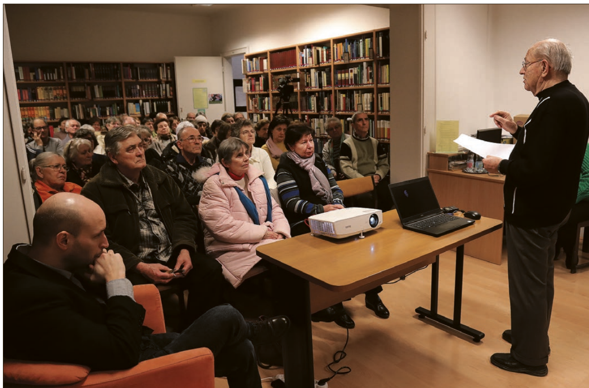
Az érdeklődők a Faludi Ferenc Városi Könyvtár hírlapolvasójában hallhattak érdekes információkat a Himnusz kapcsán

Befejezésül néhány érdekesség az előadásból: a Himnusz mellett természetesen ott van a Szózat, amit Szokolay Sándor zeneszerző a világ egyetlen illegális himnuszának nevezett. Például Romániában és más határon túli területen csak akkor szólalhatott meg a Himnusz, ha az adott ünnepségen jelen volt hazánk valamelyik hivatalos képviselője, ennek hiányában csak a Szózat hangozhatott el. A Himnusz kéziratát a Kölcsey család leszármazottai 1950-ben találták meg, és máig az ő tulajdonukban van, de egy szerződés értelmében örök időkre a Nemzeti Múzeumban helyezték le-tétbe.