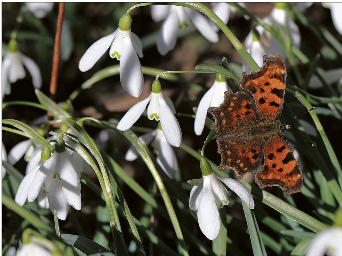
Körmenden a várkertben is lehet hóvirágra és tőzike-re bukkanni