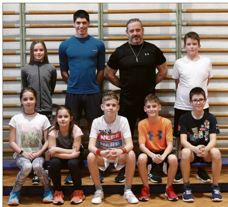
Jól szerepeltek a győri erőfelmérőn a körmentiek

A Héralészi Fizikai Erőfelmérővel elindult a kajak-kenu szezon. Az évadnyitó országos verseny egyik szervezője a győri Csay Renáta Regionális Akadémia volt, a kétnapos megmérettetésen a Bereki Bárkás Egylet Egyesület EFAFLEX Kajak-Kenu Szakosztály tizennégy versenyzővel képviseltette magát.