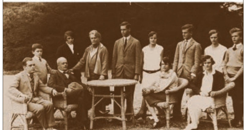
CORETH MÁRIA TERÉZIA AZ ARANYSZÍVŰ FELESÉG