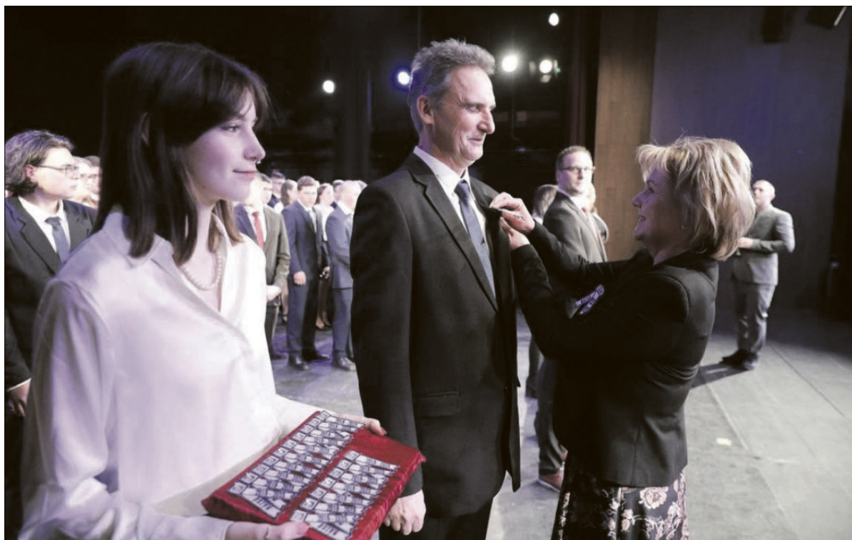
Az ünnepi szalagtűzés pillanatai

A szalagavató ünnepségek hagyományához szorosan kapcsolódnak az osztályközösségek által bemutatott különféle táncok, zenés- és verselőadások, most sem volt ez másként. A közönség láthatott meghatározó keringőt és nem a klasszikus értelemben vett férfi balettet, de a Hófehérke és a hét törpe is rövid időre a színpadra lépett nagyszerű hangulatot teremtve. Az esemény zárásaként a Körmendi Rendvédelmi Technikumban rendeztek bált, ahol már az önfelédlt szórakozás volt a főszerep. ■ SZD