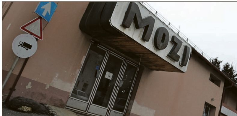
A körmen diek régi vágya válhat valóra a megújuló mozi épületével