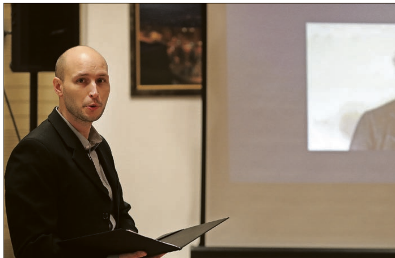
Erkel Ferenc körülbelül egy óra alatt komponálta meg a dallamot a Himnuszhoz – derült ki Morvay András előadásából

Kisfaludy Sándor 1820-ban Magyar nemzeti ének címmel írt egy nemzeti himnusznak szánt költeményt, de nem vált azzá. Valószínű, hogy Kölcseyre a Balassi Bálint versének gondolt „Kiben kesereg a magyar nemzetnek romlásán s fogyássán” című költemény hatott, ami a Balassa-kódexben jelent meg. Szerzője valójában Rimay János volt. Feltehetőleg ennek hatására kezdte el saját versét papírra vetni még 1822-ben, amit 1823. január 22-én tisztázott le. A kézirat nem szerepelt az alcíme, és amikor 1829-ben megjelent az Aurórában, akkor sem. „A magyar nép zivataros századaiból” alcím csak az 1832-ben kiadott verseskötetében jelent meg először. A Pesti Kaszinóban 1832-ben szavaltta el először