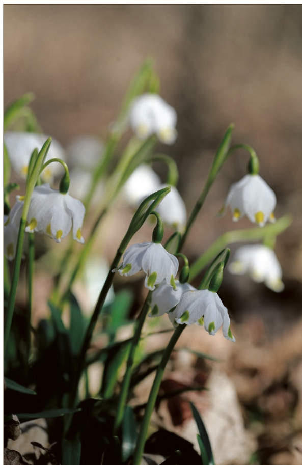
A virágzó tőzikek száma a Dobogó-erdőben napokon belül elérheti az ötmilliót is