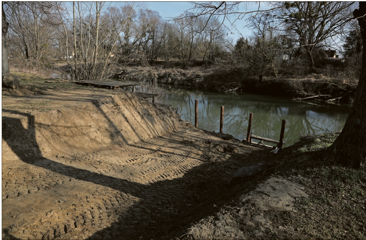
A Rába parton javában folyik a munka- jelentős turisztikai fejlesztés ez

Adóemeléssel csak idegenforgalmi adó esetében élt tavaly év végén a testület, ezzel jelentősen segítjük a lakosságot, mert új adó sem került bevezetésre, így Körmeden továbbra is csak az iparüzési és ide-