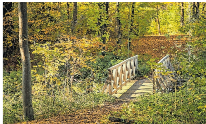
Ősszel a körmendi Várkert is csodálatos