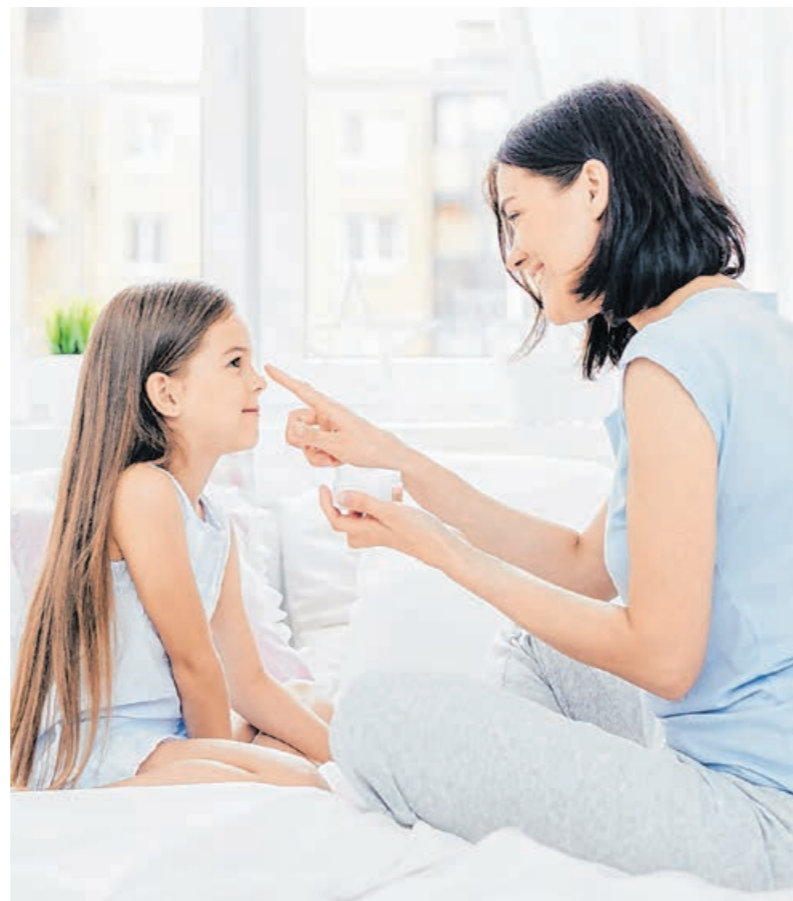
A lakás fűtött levegője nem kedvez a bőr nedvességtartalmának FOTÓ: ILLUSZTRÁCIÓ

A babák és kisgyermekek bőre sem egyformán érzékeny, de számukra csakis olyan készítmények javasoltak, amelyek megbízható gyártótól származnak, és ahol ténylegesen odafigyelnek a kozmetikumok minőségére és a káros kemikáliák mellőzésére – például tartósítószer (parabén), illatanyagok, lanolin, kócolajszármazékok (vazelin, paraffin), amelyek egyébként is szárítják a bőrt. Fürdetéskor nem szükséges közvetlenül a bőrre juttatni a habfürdőből, tusfürdőből, főleg nem kell szappanozni a karokat és a lábakat, hanem pedig a törzset, hiszen ezek a testrészek