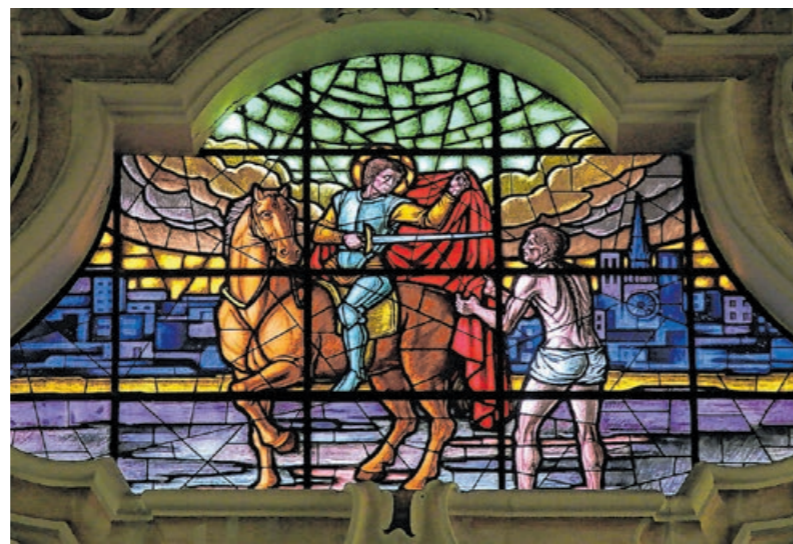
Egy téli este Szent Márton kilépett Ambianensium (ma Amiens) kapuján, amikor nékülöz koldussal találkozott, akit rablók fosztottak ki és vertek meg. Saját köpenyét kardjával kettévágta, egyik felét a koldus vállára borította. A felvételt az olaszországi Martina Franca városában készült a Szent Márton Bazilikában

– Márton, akire az akkori keresztények hiteles élete és hősie hitvallása nagy hatást tett, már fiatal korától kezdve mély kapcsolatba akart kerülni Jézussal. Legfőbb vágya a