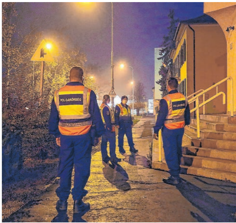
A körmendi polgárok a lezárások előtt járöröztek a városban